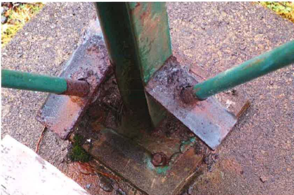
Photo 7: Base Connection 2 of the steel platform showing rusting issues