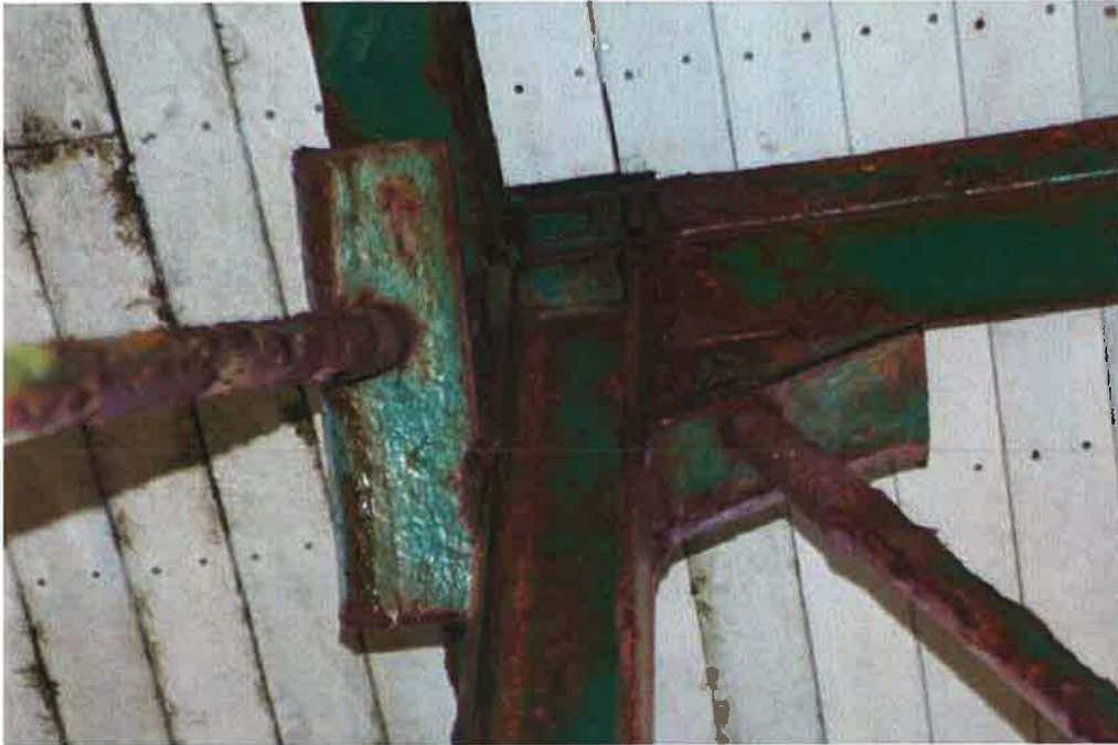
Photo 2: Top Connection 1 of the steel platform showing rusting issues