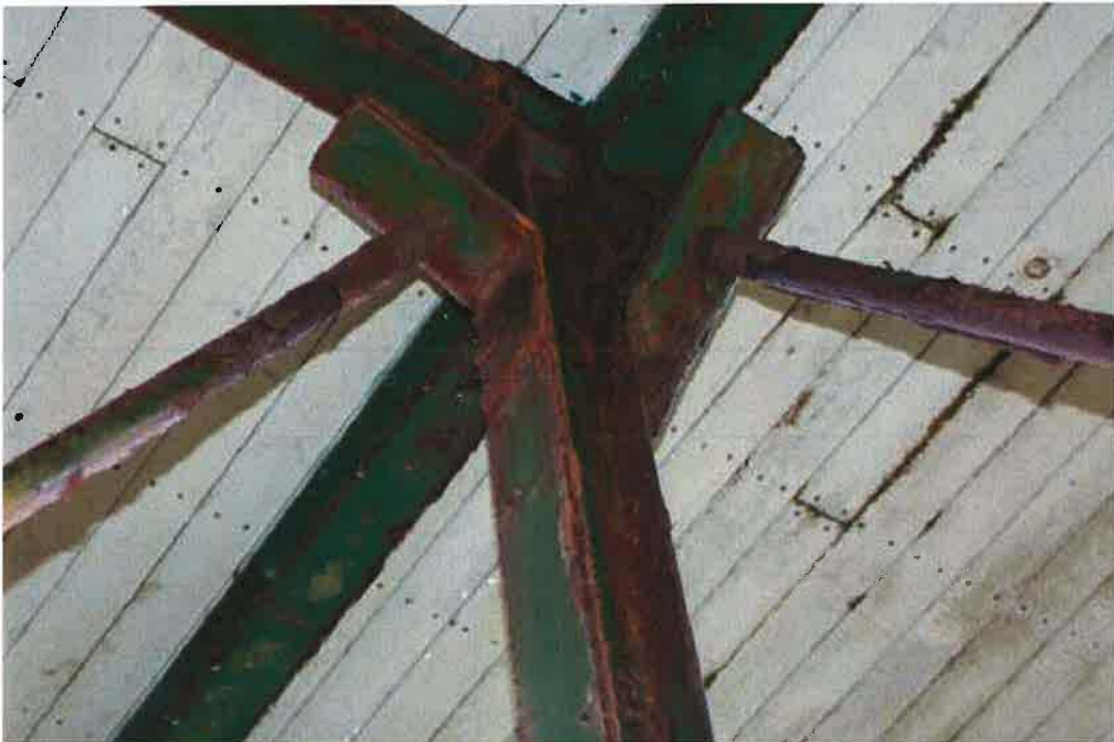
Photo 3: Top Connection 2 of the steel platform showing rusting issues