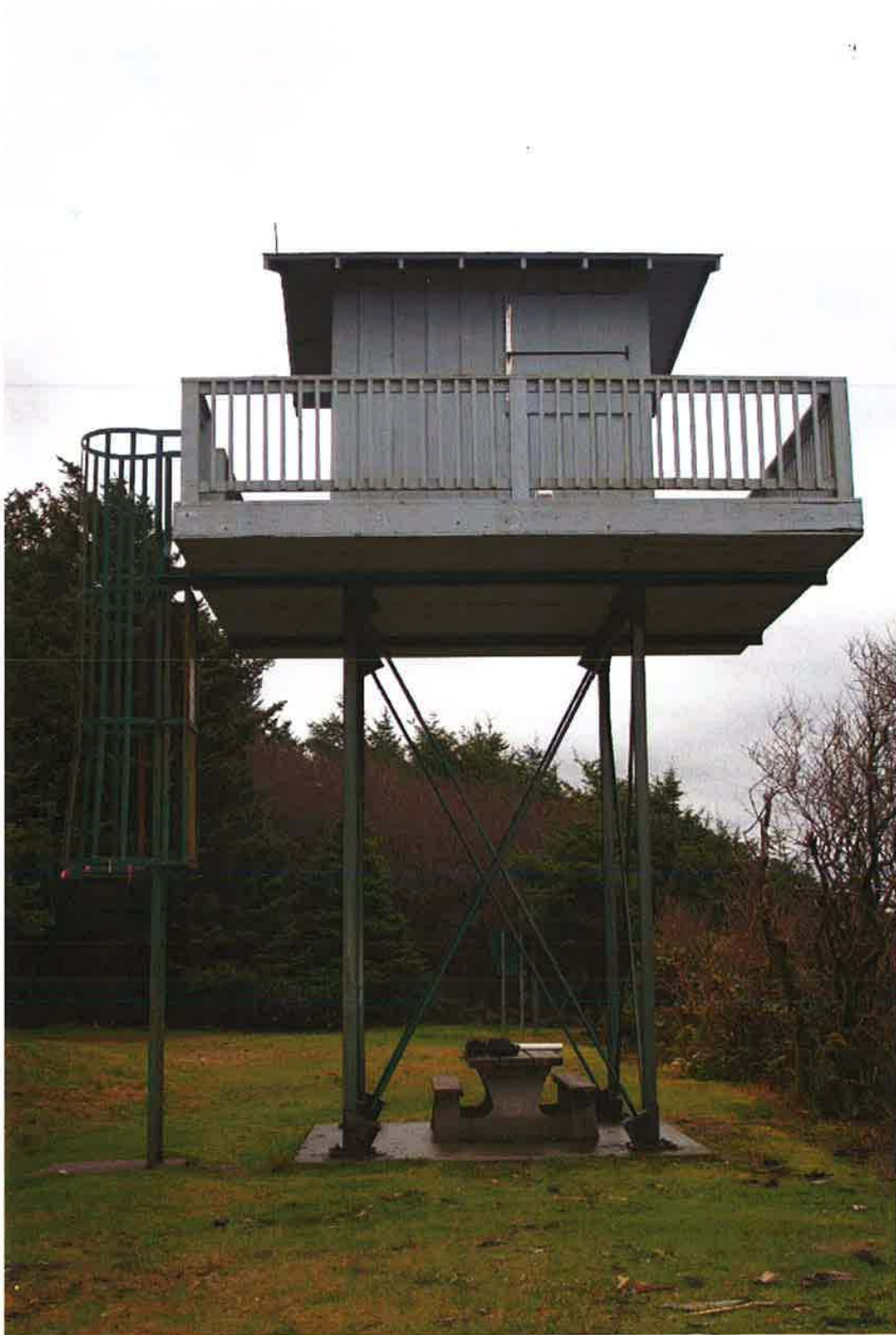
Photo 1: Full view of the Sun Surf Watch Tower at Long Beach, Tofino, BC.