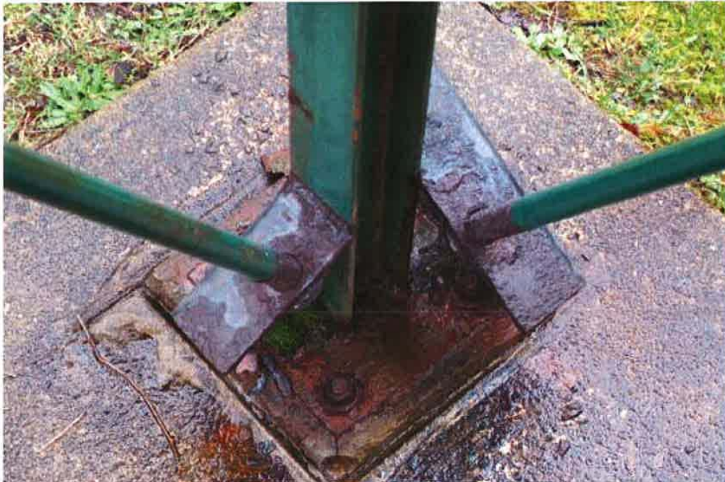
Photo 6: Base Connection 1 of the steel platform showing rusting issues