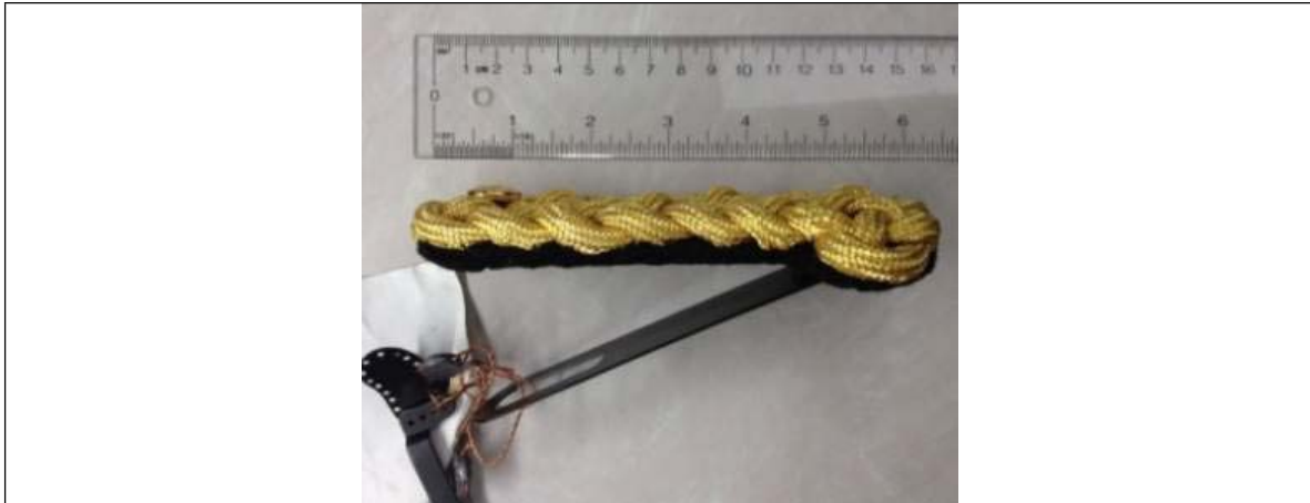
DSSPM 633-96 – Right Shoulder