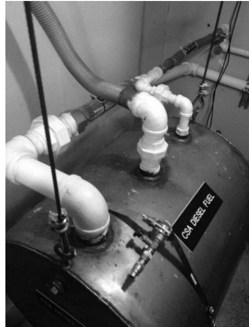
2: CSA - Réservoir hors-terre (RHT) - réservoir à essence