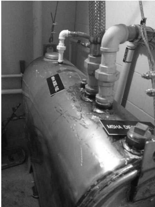
1: MSHA - Réservoir hors-terre (RHT) - réservoir à essence

2- AJOUTER LES CINQ (5) PHOTOS SUIVANTES À L'ANNEXE C DE LA DEMANDE DE PROPOSITION: