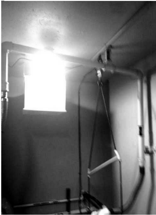
3: Cellule de charge: jauge de contrainte et câble, MSHA RHT