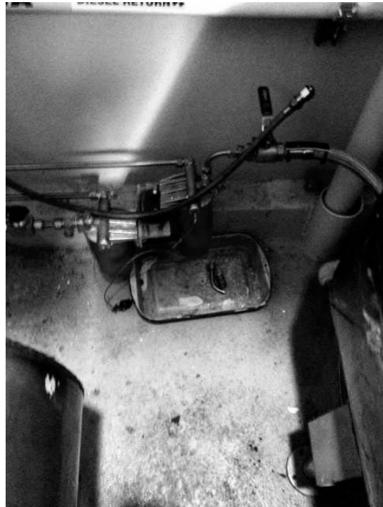
4: Fuel filter set from both the CSA AST (L) and MSHA AST (R)