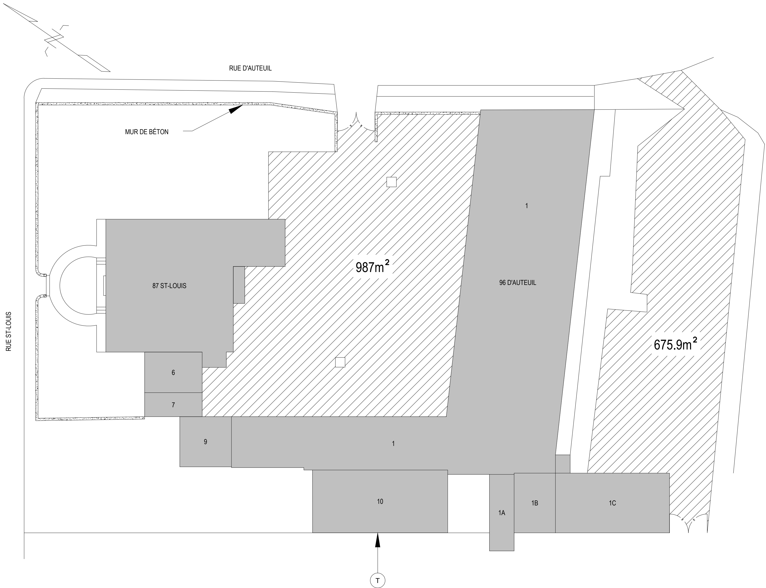
CASERNE ST-LOUIS RUE D'AUTEUIL ÉCHELLE: 1:250 SURFACE APPROXIMATIVE: 1 662.9m²