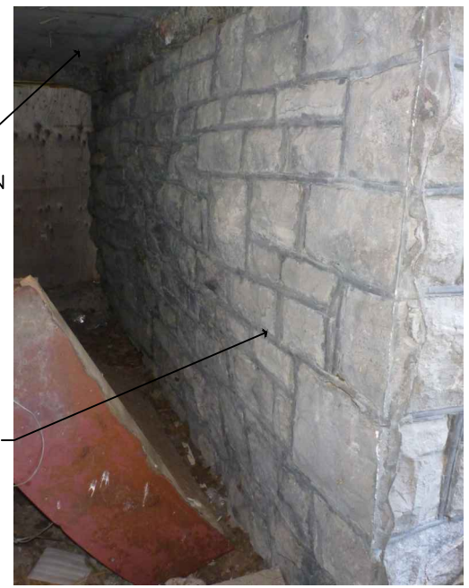
— DÉTAIL PHOTO — (C) MUR PERPENDICULAIRE EXISTANT

RÉCUPÉRER LES PIERRES DE L'INTÉRIEUR POUR UTILISER LORS DE LA RECONSTRUCTION. RETOURNER LES PIERRES NON-UTILISÉES AU PROPRIÉTAIRE