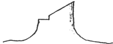
d) Trait d'abattage angulaire