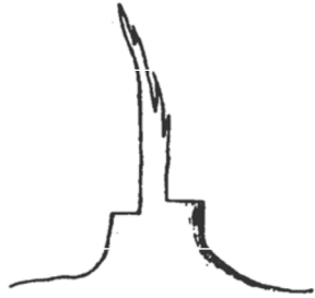
a) Chaise de barbier