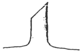
c) Coupe angulaire