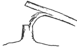
f) Abattage incomplet