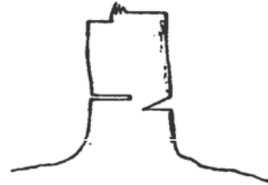
b) Bloc restant