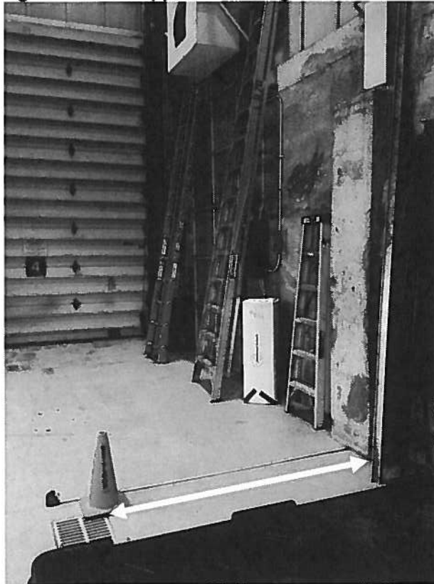
Figure 1: Hook Approach - Bridge Axis