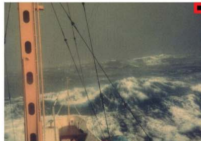
BEAUFORT FORCE 11 WIND SPEED: 56-63 KNOTS SEA: WAVE HEIGHT 11.5-16M (37-52FT), EXCEPTIONALLY HIGH WAVES, SMALL-MEDIUM SIZED SHIPS MAY BE LOST TO VIEW BEHIND THE WAVES, SEA COMPLETELY COVERED WITH LONG WHITE PATCHES OF FOAM LYING ALONG WIND DIRECTION, EVERYWHERE, THE EDGES OF WAVE CRESTS ARE BLOWN INTO FROTH.