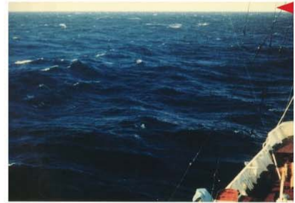
BEAUFORT FORCE 6 WIND SPEED: 22-27 KNOTS SEA: WAVE HEIGHT 3-4M (9.5-13 FT), LARGER WAVES BEGIN TO FORM, SPRAY IS PRESENT, WHITE FOAM CRESTS ARE EVERYWHERE