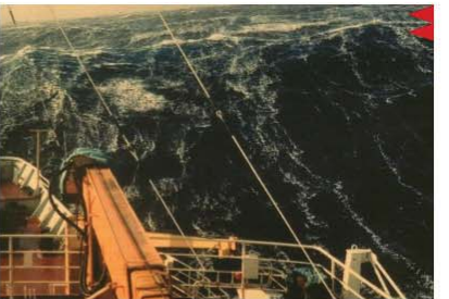
BEAUFORT FORCE 9 WIND SPEED: 41-47 KNOTS SEA: WAVE HEIGHT 7-10M (23-32FT), HIGH WAVES, DENSE STREAKS OF FOAM ALONG DIRECTION OF THE WIND, WAVE CRESTS BEGIN TO TOPPLE, TUMBLE, AND ROLL OVER. SPRAY MAY AFFECT VISIBILITY.