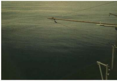
BEAUFORT FORCE 0 WIND SPEED: LESS THAN 1 KNOT SEA: SEA LIKE A MIRROR