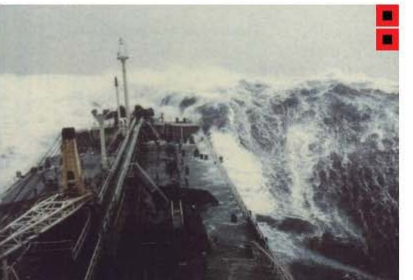
BEAUFORT FORCE 12 WIND SPEED: 64 KNOTS SEA: SEA COMPLETELY WHITE WITH DRIVING SPRAY, VISIBILITY VERY SERIOUSLY AFFECTED, THE AIR IS FILLED WITH FOAM AND SPRAY