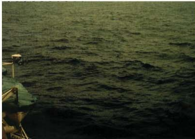
BEAUFORT FORCE 4 WIND SPEED: 11-16 KNOTS SEA: WAVE HEIGHT 1-1.5M (3.5-5FT), SMALL WAVES BECOMING LONGER, FAIRLY FREQUENT WHITE HORSES