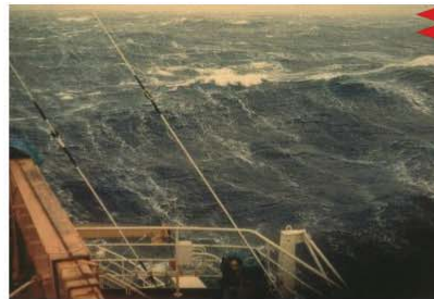
BEAUFORT FORCE 8 WIND SPEED: 34-40 KNOTS SEA: WAVE HEIGHT 5.5-7.5M (18-25FT), MODERATELY HIGH WAVES OF GREATER LENGTH, EDGES OF CREST BEGIN TO BREAK INTO THE SPINDRIFT, FOAM BLOWN IN WELL MARKED STREAKS ALONG WIND DIRECTION.