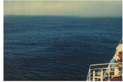
BEAUFORT FORCE 2 WIND SPEED: 4-6 KNOTS SEA: WAVE HEIGHT 2-3M (.5-1FT), SMALL WAVELETS, CRESTS HAVE A GLASSY APPEARANCE AND DO NOT BREAK