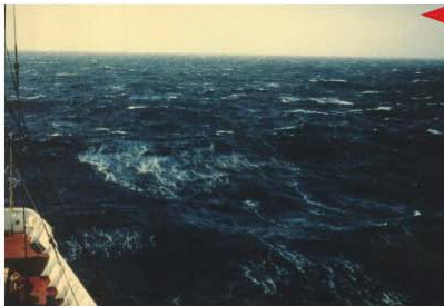
BEAUFORT FORCE 7 WIND SPEED: 28-33 KNOTS SEA: WAVE HEIGHT 4-5.5M (13.5-19 FT), SEA HEAPS UP, WHITE FOAM FROM BREAKING WAVES BEGINS TO BE BLOWN IN STREAKS ALONG THE WIND DIRECTION