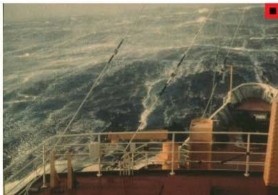
BEAUFORT FORCE 10 WIND SPEED: 48-55 KNOTS SEA: WAVE HEIGHT 9-12.5M (29-41FT), VERY HIGH WAVES WITH LONG OVERHANGING CRESTS, THE RESULTING FOAM, IN GREAT PATCHES, IS BLOWN IN DENSE WHITE STREAKS ALONG WIND DIRECTION, ON THE WHOLE, SEA SURFACE TAKES A WHITE APPEARANCE, TUMBLING OF THE SEA IS HEAVY AND SHOCK-LIKE, VISIBILITY AFFECTED.