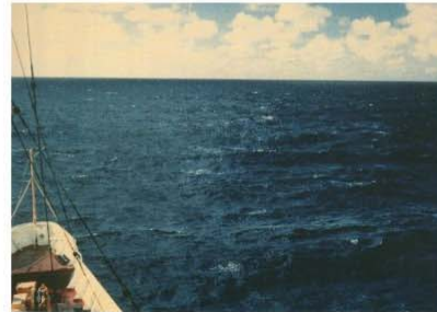
BEAUFORT FORCE 5 WIND SPEED: 17-21 KNOTS SEA: WAVE HEIGHT 2-2.5M (6-8FT), MODERATE WAVES TAKING MORE PRONOUNCED LONG FORM, MANY WHITE HORSES, CHANCE OF SOME SPRAY