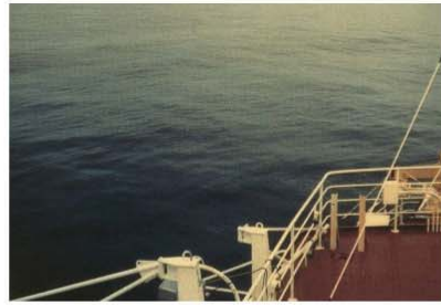
BEAUFORT FORCE 1 WIND SPEED: 1-3 KNOTS SEA: WAVE HEIGHT 1M (.25FT), RIPPLES WITH THE APPEARANCE OF SCALES, BUT WITHOUT FOAM CRESTS