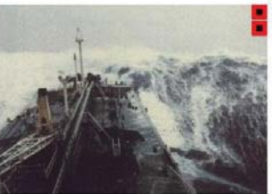
BEAUFORT FORCE 11 WIND SPEED: 64 KNOTS SEA: SEA COMPLETELY WHITE WITH DRIVING SPRAY, VISIBILITY VERY SERIOUSLY AFFECTED, THE AIR IS FILLED WITH FOAM AND SPRAY

Bateau à propulsion hydraulique de 5,8 m à 5,99 m en aluminium