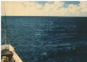
BEAUFORT FORCE 4 WIND SPEED: 17-21 KNOTS SEA: WAVE HEIGHT 2-2.5M (6-8FT). MODERATE WAVES TAKING MORE PRONOUNCED LONG FORM. MANY WHITE HORSES. CHANGE OF SOME SPRAY