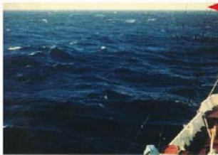
BEAUFORT FORCE 5 WIND SPEED: 22-27 KNOTS SEA: WAVE HEIGHT 3-4M (9.5-13 FT). LARGER WAVES BEGIN TO FORM. SPRAY IS PRESENT, WHITE FOAM CRESTS ARE EVERYWHERE