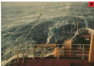
BEAUFORT FORCE 9 WIND SPEED: 48-55 KNOTS SEA: WAVE HEIGHT 9-12.5M (29-41FT). VERY HIGH WAVES WITH LONG OVERHANGING CRESTS, THE RESULTING FOAM, IN GREAT PATCHES, IS BLOWN IN DENSE WHITE STREAKS ALONG WIND DIRECTION. ON THE WHOLE, SEA SURFACE TAKES A WHITE APPEARANCE, TUMBLING OF THE SEA IS HEAVY AND SHOCK-LIKE, VISIBILITY AFFECTED.