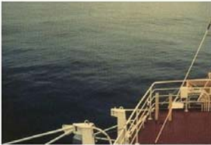
BEAUFORT FORCE 1 WIND SPEED: 1-3 KNOTS SEA: WAVE HEIGHT 1M (3FT). RIPPLES WITH THE APPEARANCE OF SCALES, BUT WITHOUT FOAM CRESTS