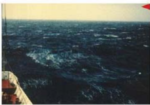
BEAUFORT FORCE 6 WIND SPEED: 28-33 KNOTS SEA: WAVE HEIGHT 4.5-5.5M (13.5-18 FT). SEA HEAPS UP; WHITE FOAM FROM BREAKING WAVES BEGIN TO BE BLOWN IN STREAKS ALONG THE WIND DIRECTION