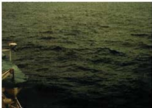
BEAUFORT FORCE 3 WIND SPEED: 11-16 KNOTS SEA: WAVE HEIGHT 1.1-1.5M (3.5-5FT). SMALL WAVES BECOMING LONGER, FAIRLY FREQUENT WHITE HORSES