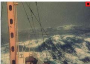
BEAUFORT FORCE 10 WIND SPEED: 56-63 KNOTS SEA: WAVE HEIGHT 11.5-16M (37-52FT). EXCEPTIONALLY HIGH WAVES, SMALL-MEDIUM SIZED SHIPS MAY BE LOST TO VIEW BEHIND THE WAVES, SEA COMPLETELY COVERED WITH LONG WHITE PATCHES OF FOAM LYING ALONG WIND DIRECTION. EVERYWHERE, THE EDGES OF WAVE CRESTS ARE BLOWN INTO PROTH.