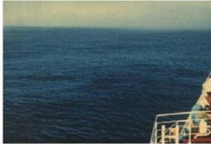
BEAUFORT FORCE 2 WIND SPEED: 4-6 KNOTS SEA: WAVE HEIGHT 2-3M (5-10FT). SMALL WAVELETS, CRESTS HAVE A GLASSY APPEARANCE AND DO NOT BREAK