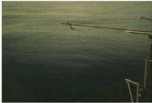
BEAUFORT FORCE 0 WIND SPEED: LESS THAN 1 KNOT SEA: SEA LIKE A MIRROR

Buyer ID - Id de l'acheteur xlv166 CCC No./N° CCC - FMS No./N° VME