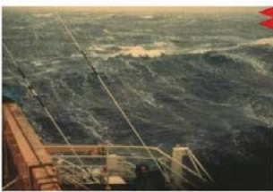
BEAUFORT FORCE 7 WIND SPEED: 34-40 KNOTS SEA: WAVE HEIGHT 5.5-7.5M (18-25FT). MODERATELY HIGH WAVES OF GREATER LENGTH, EDGES OF CREST BEGIN TO BREAK INTO THE SPINDRIFT, FOAM BLOWN IN WELL MARKED STREAKS ALONG WIND DIRECTION