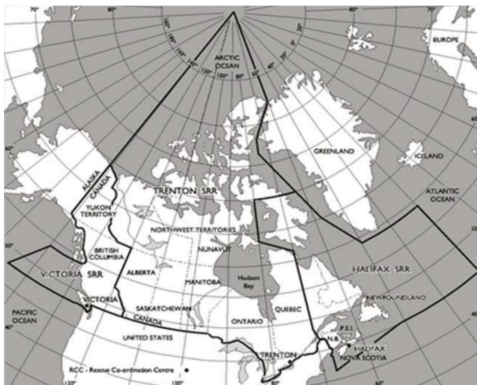
Figure 2 – Zones de recherche et sauvetage sous la responsabilité du Canada