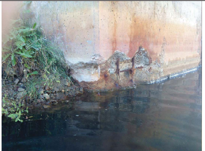
Northwest wingwall/abutment corner