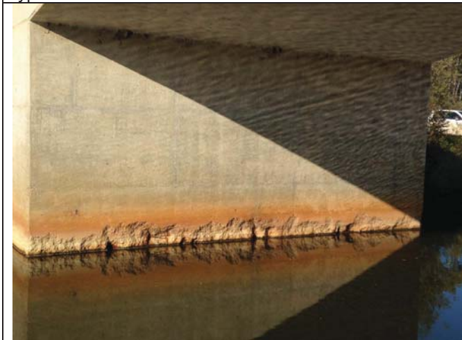
View of south abutment face