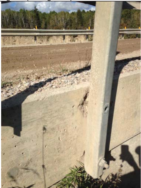
Damaged bridge rail post anchor