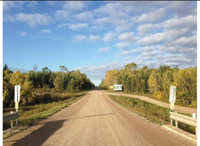
Looking South along Pine Lake Road