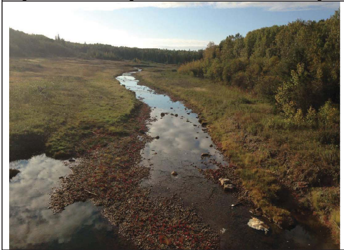
Looking upstream from bridge site