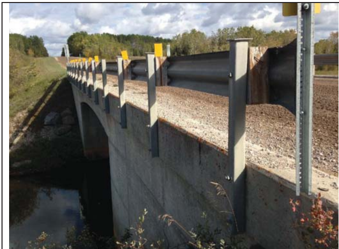
West bridge rail (looking north)