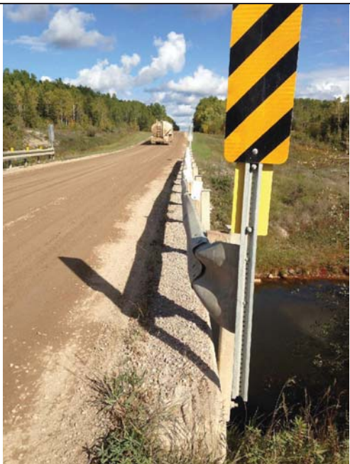
East bridge rail (looking north)