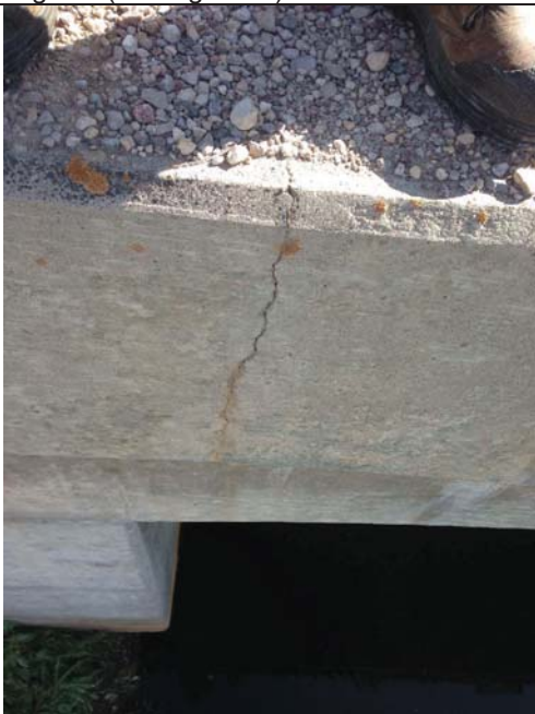
Cracks in curb