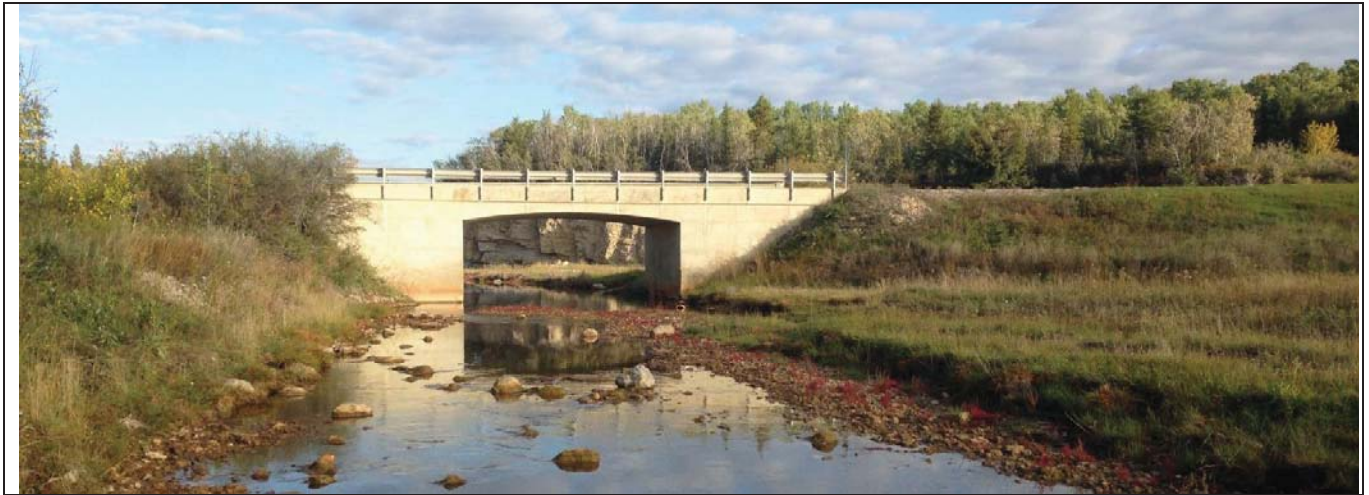
Salt River Bridge – Looking downstream