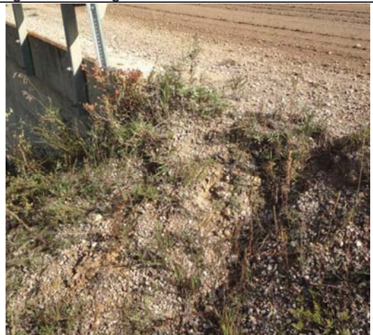
Southwest approach – drainage erosion