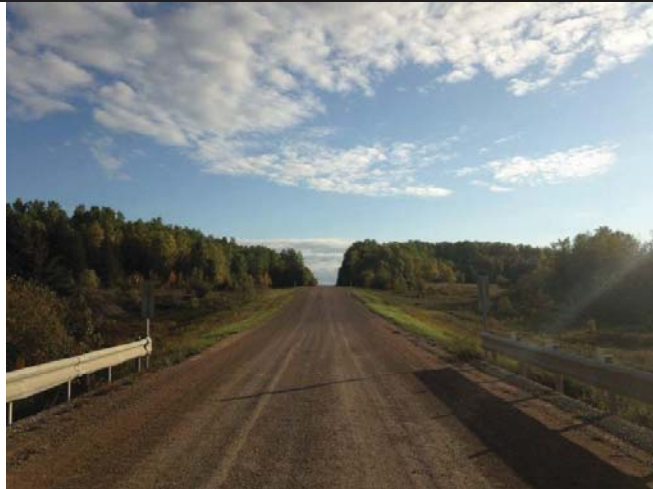
Looking north along Pine Lake Road