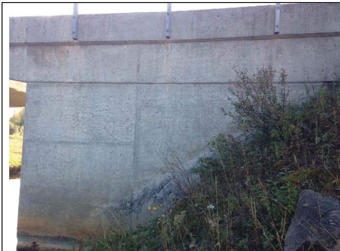
View of southwest wingwall showing loss of fill material, typical all four corners