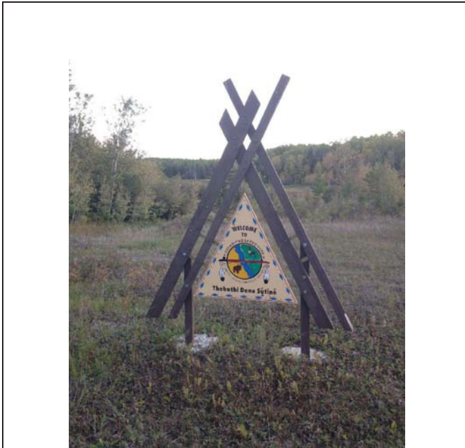
Sign of Smith Landing First Nation to northeast of bridge