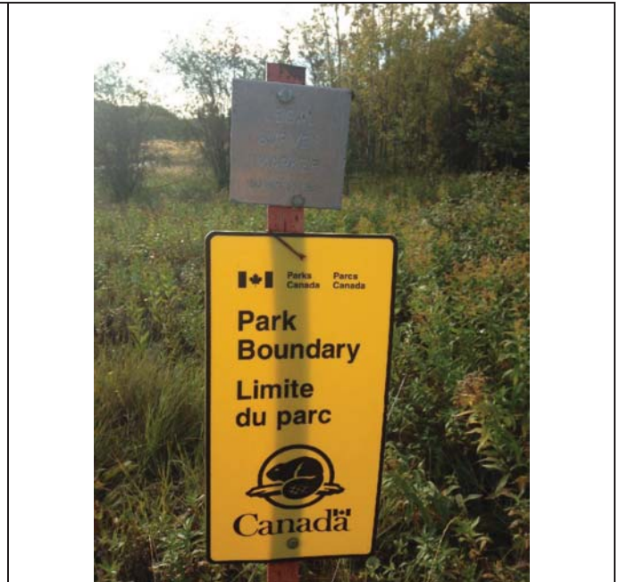
Park Boundary signs to southeast of bridge