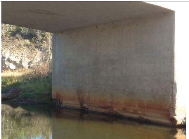
North abutment face