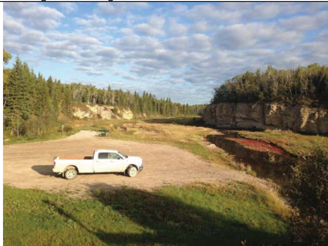
Parking area southwest of bridge