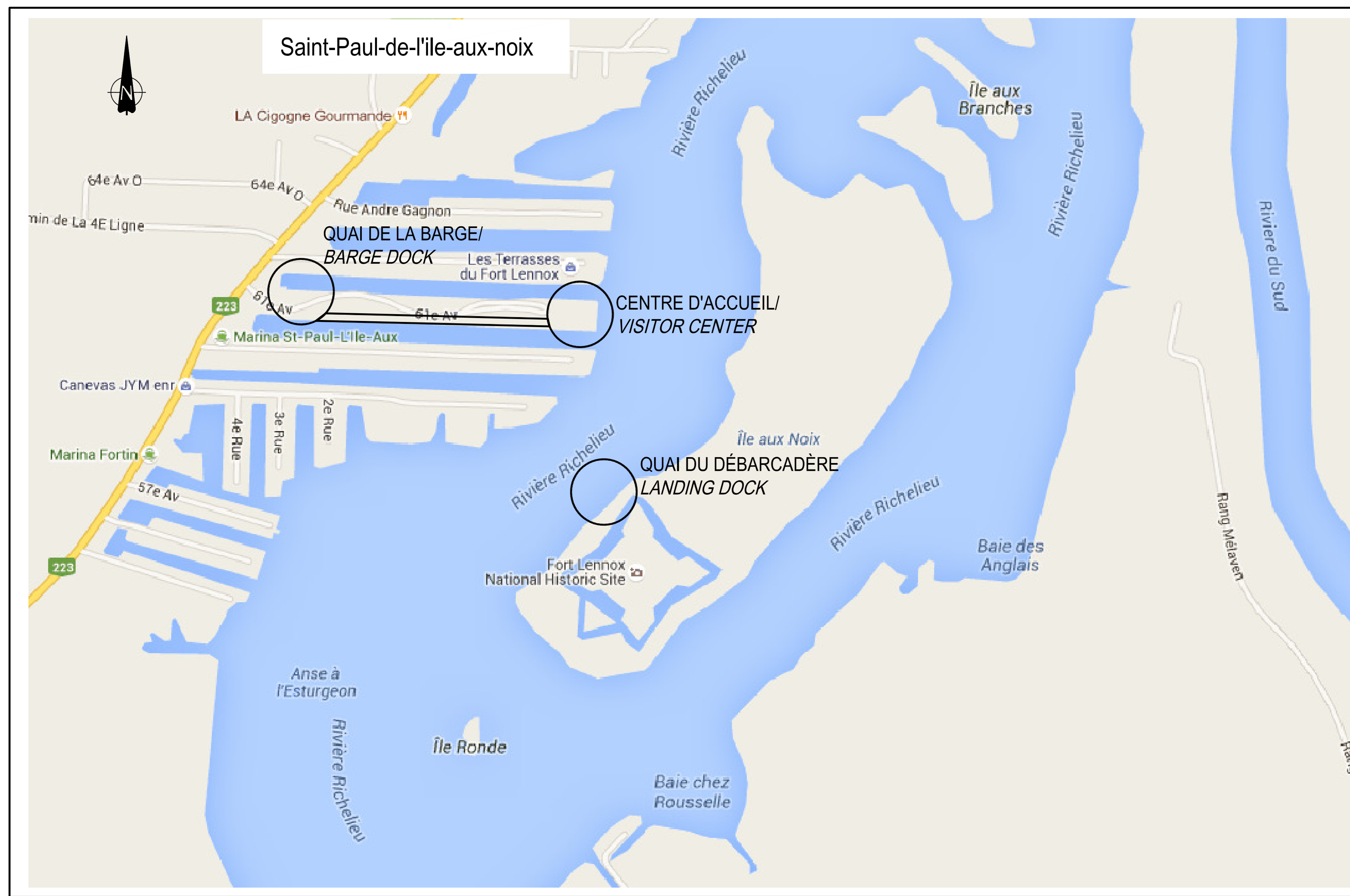
LOCALISATION DES TRAVAUX LOCATION OF WORKS