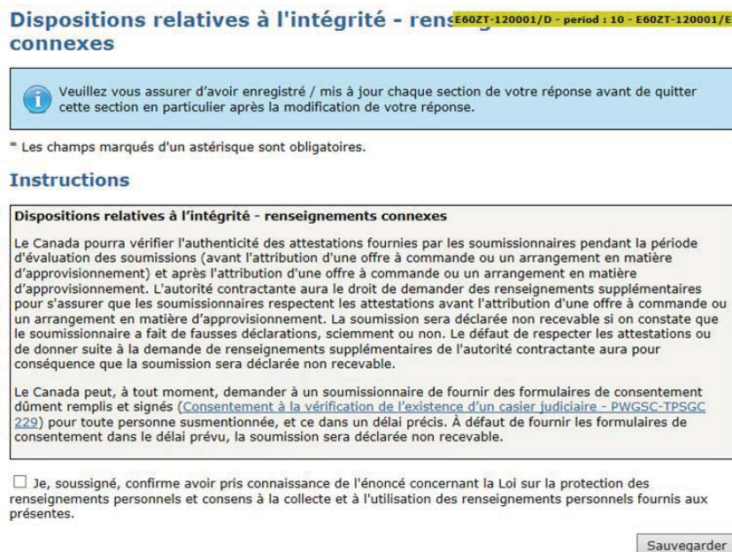
Figure 2. Nouvel affichage, depuis le 10 août 2016