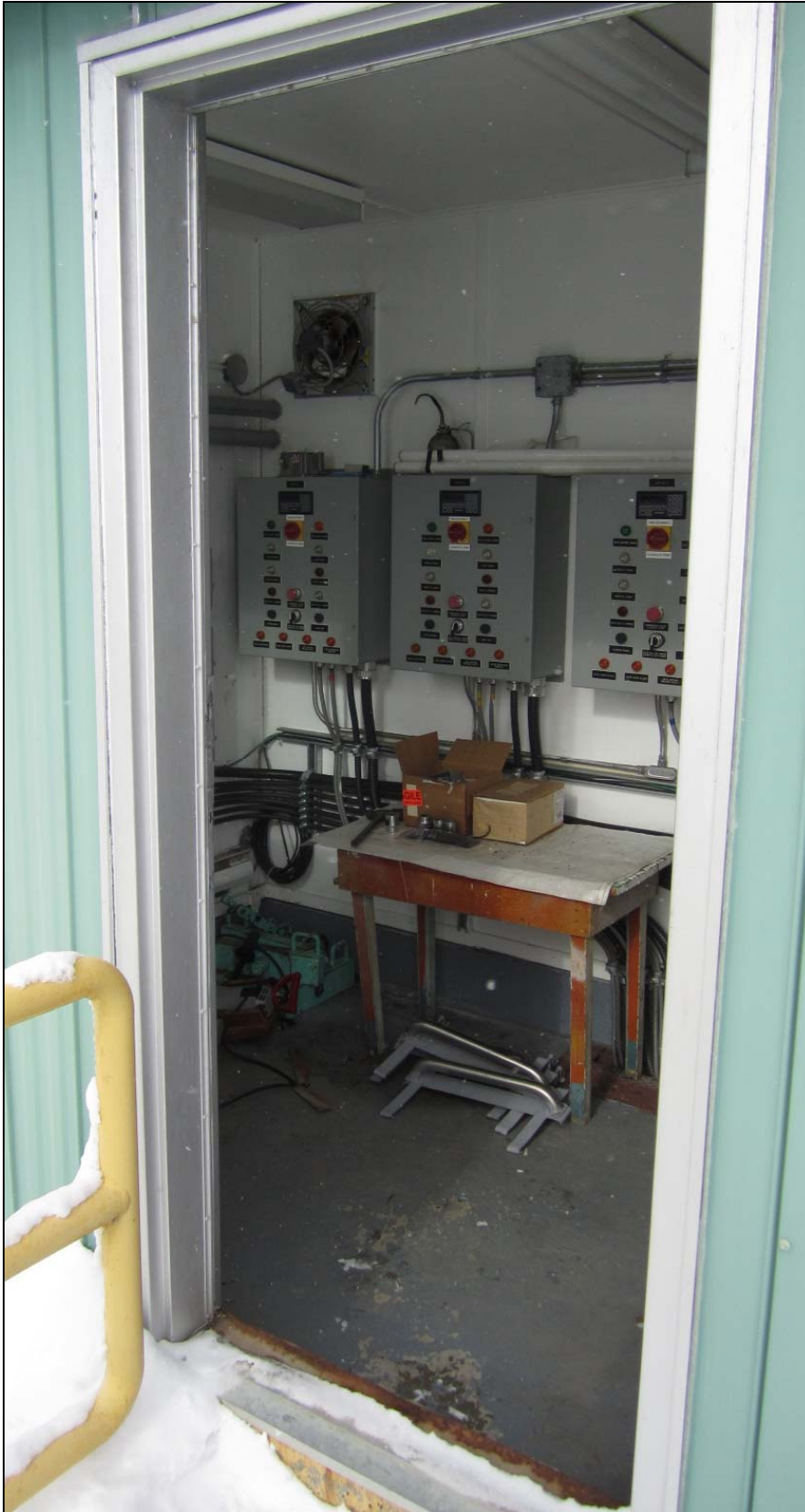
Figure 22 – Interior of electrical building, Portage Dam. /// Intérieur du bâtiment électrique, barrage Portage.