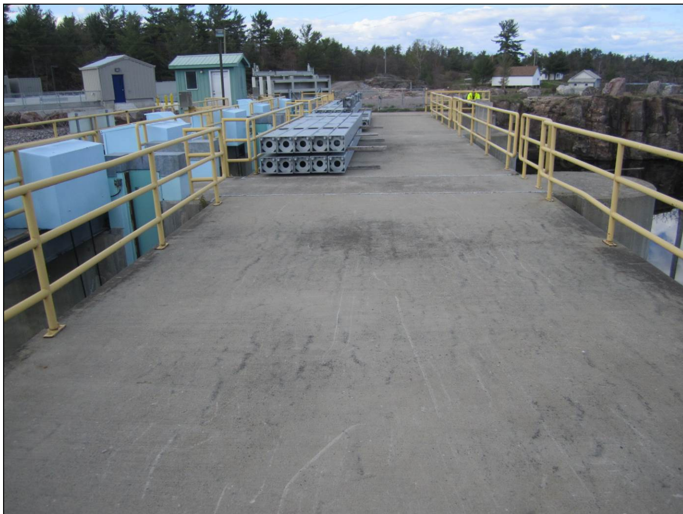
Figure 6 - Pedestrian deck of Portage Dam with stoplogs stored on deck, view looking towards the right abutment. /// Tablier piétonnière du barrage Portage avec l'entreposage de poutrelles, vue en regardant vers la culée droite.