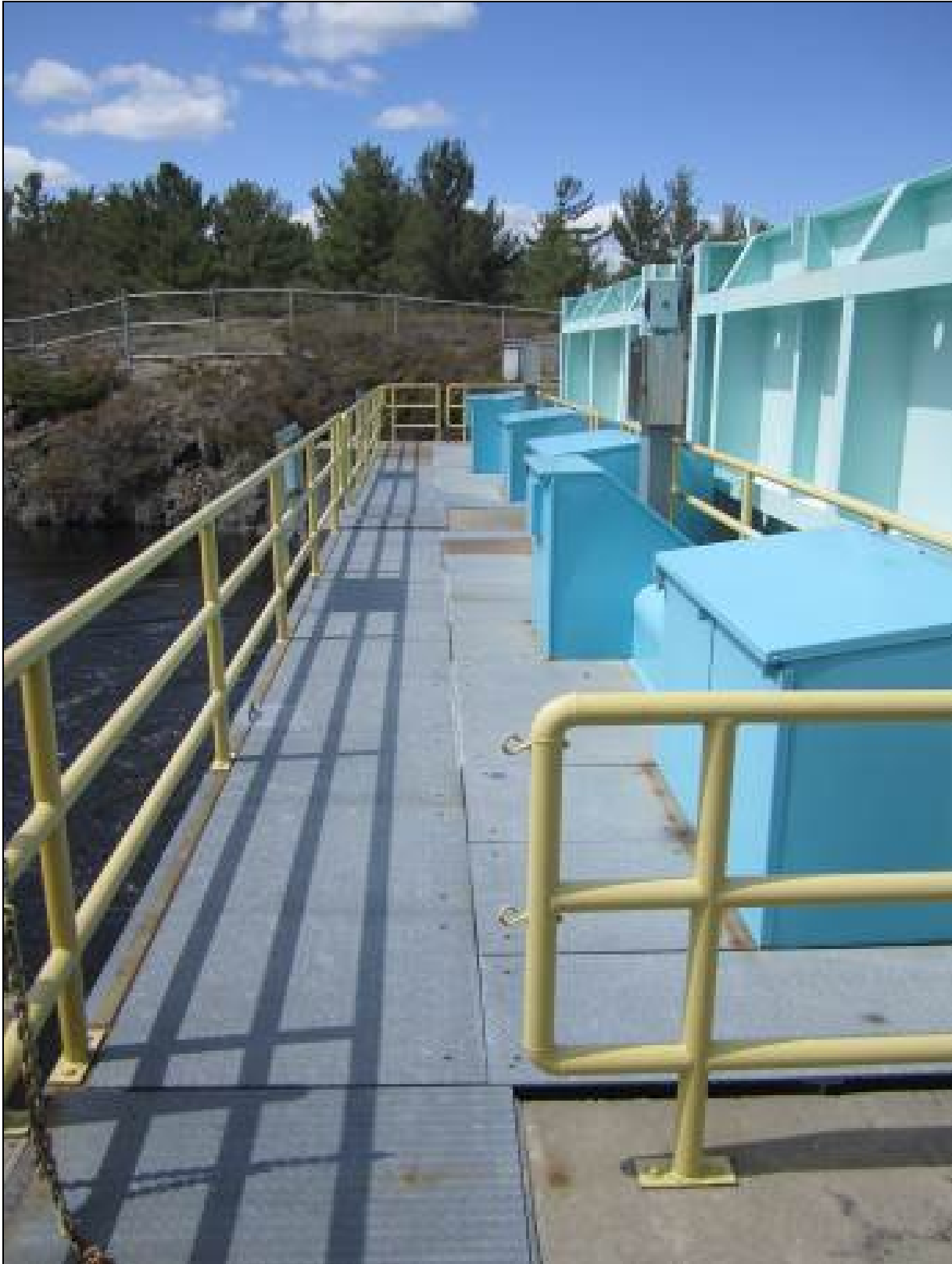
Figure 9 - Mechanical deck of Little Chaudière Dam, view looking towards right abutment. /// Tablier mécanique du barrage Little Chaudière, vue en regardant vers la culée droite.