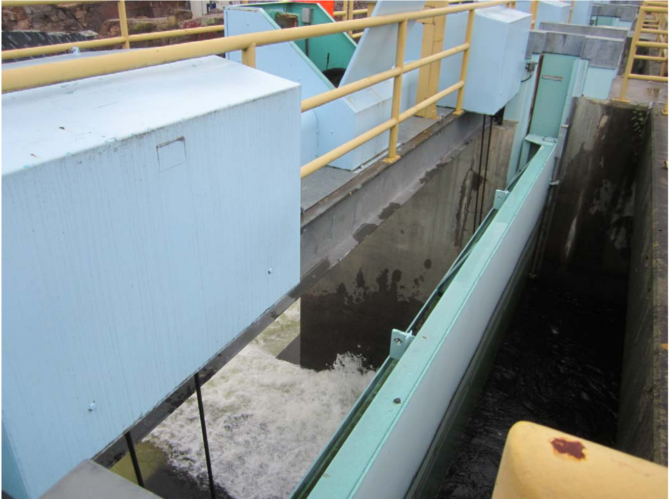
Figure 14 – Gate in its gain, Portage Dam. /// Vue d'une vanne dans sa rainure, barrage Portage.