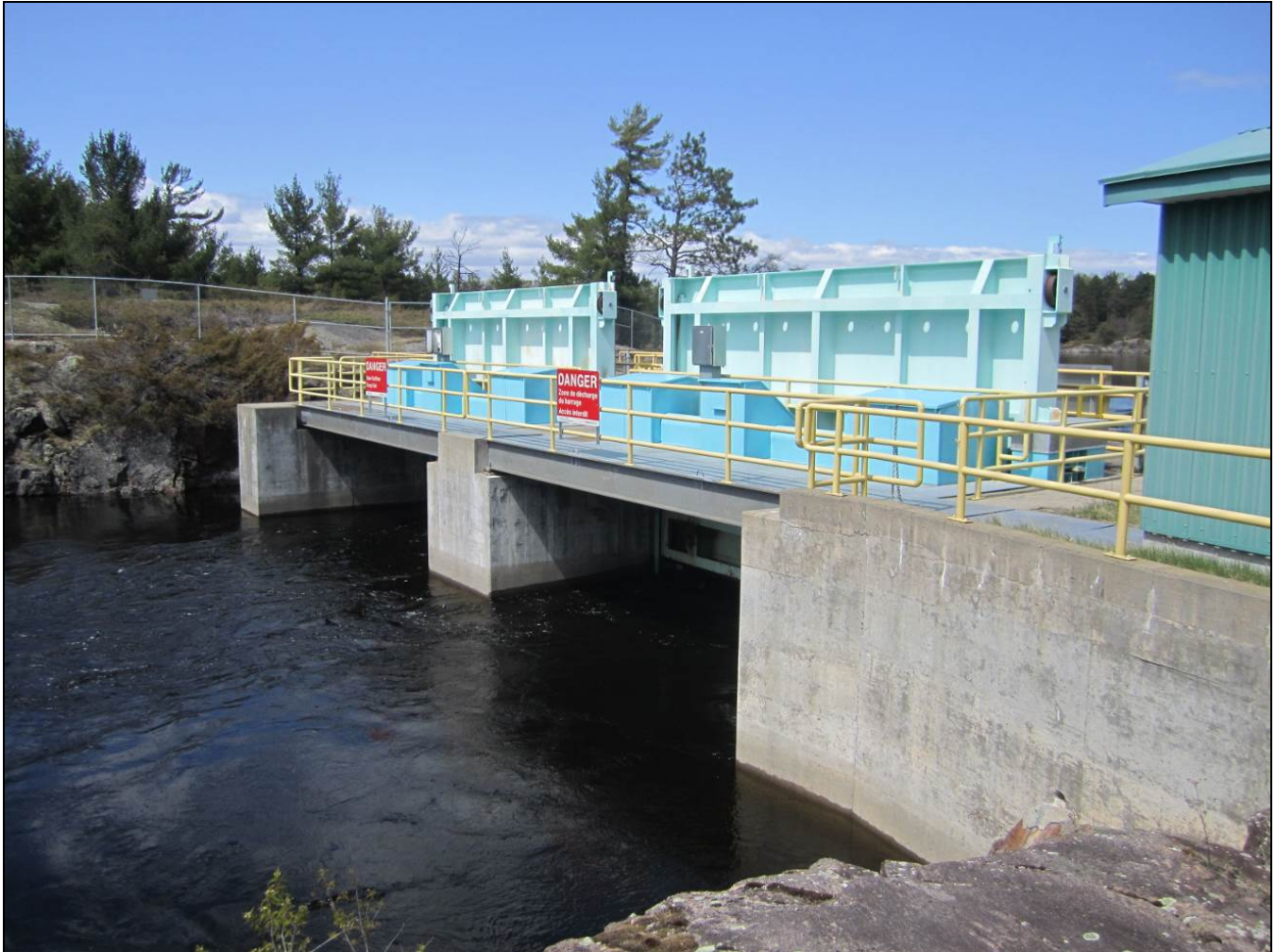
Figure 5 - Little Chaudière Dam, downstream side. /// Barrage Little Chaudière, côté aval.