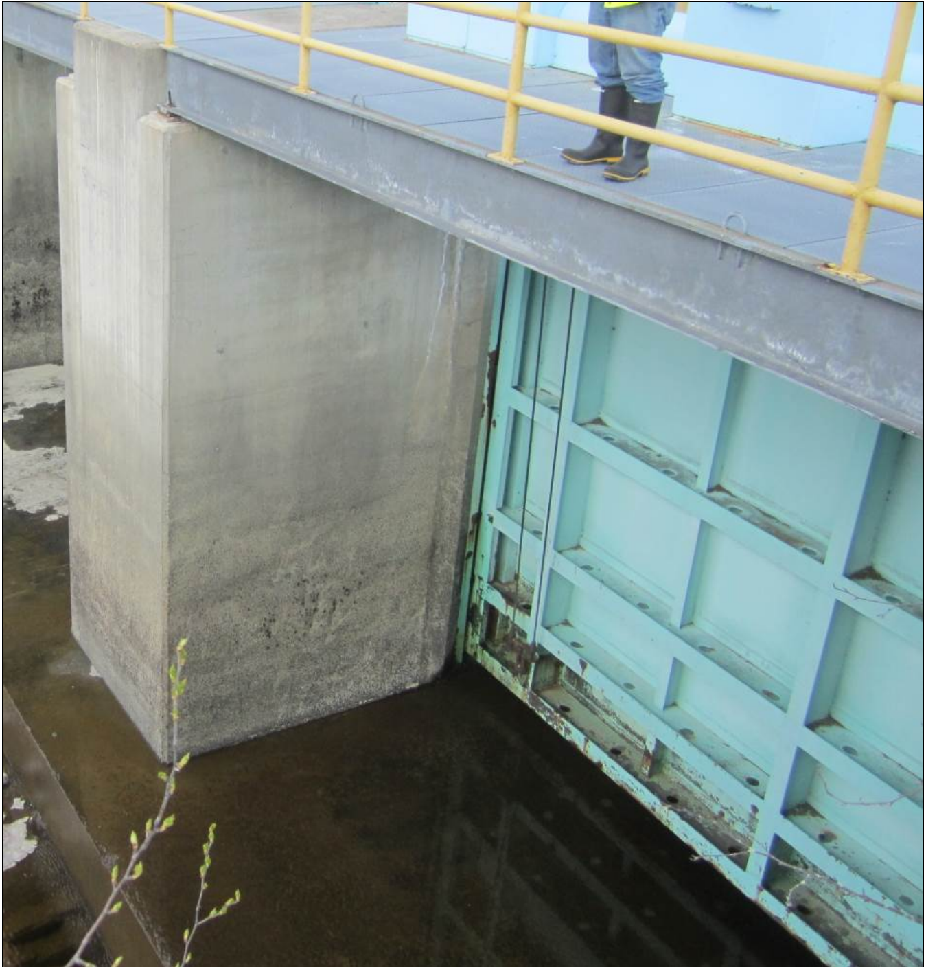
Figure 11 – Portage Dam, downstream side, with all gates closed. /// Barrage Portage, côté aval avec tous les portes fermées.