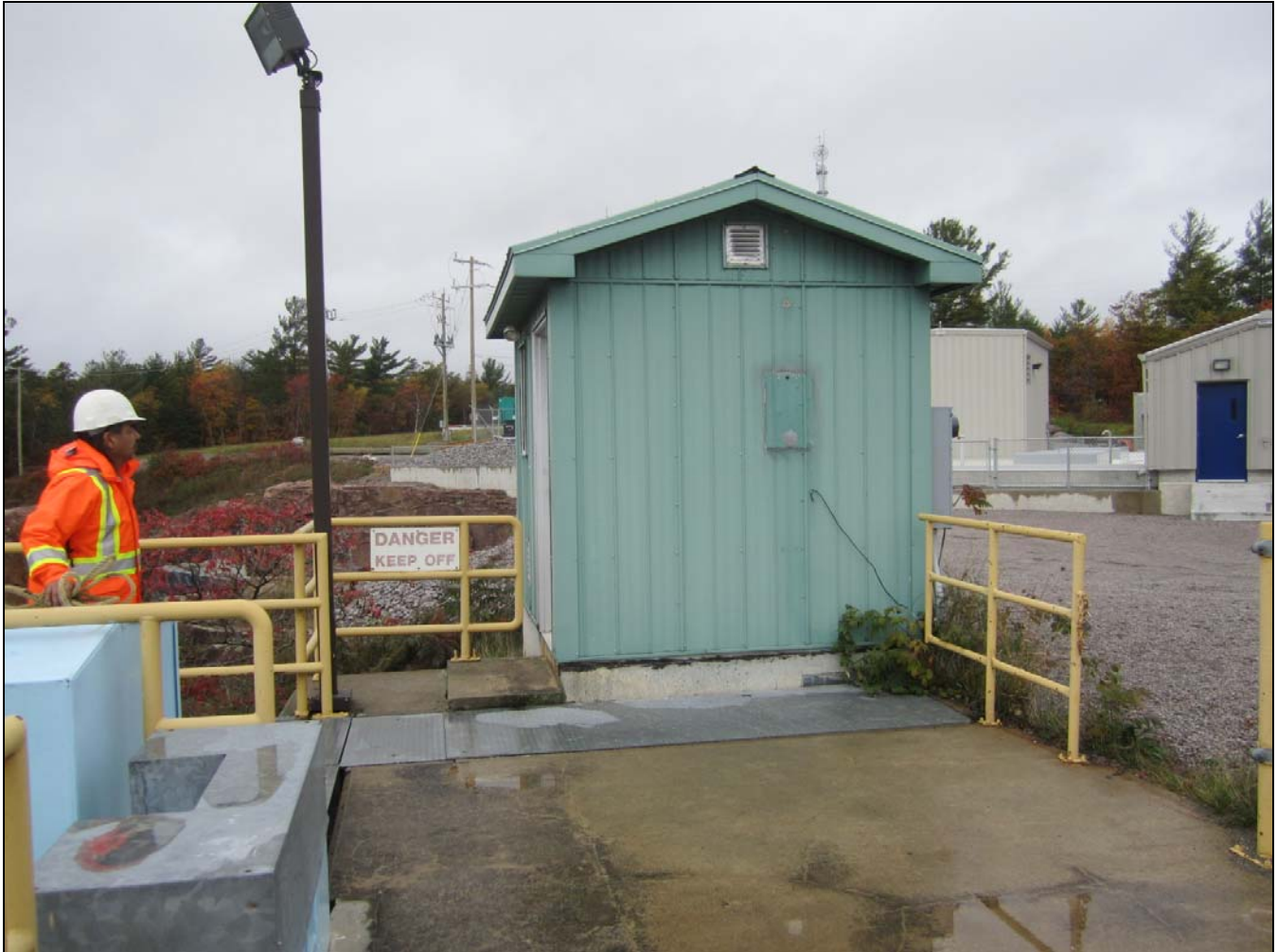
Figure 21 - Electrical building at Portage Dam. /// Bâtiment électrique au barrage Portage.