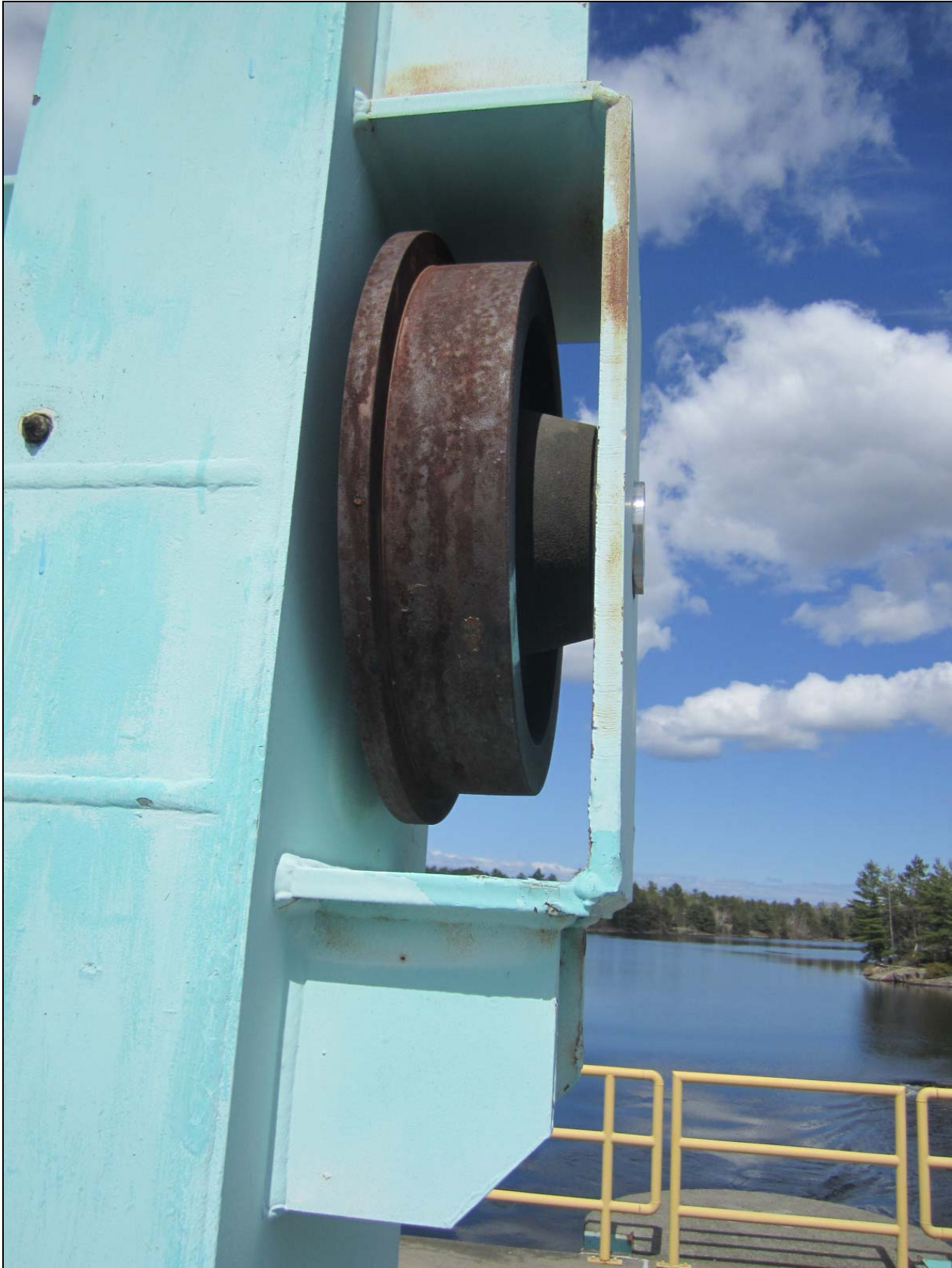
Figure 13 – Detail showing one of the upper gate wheels. Little Chaudière Dam. /// Détail montrant une des roues de vannes supérieures. Barrage Little Chaudière.