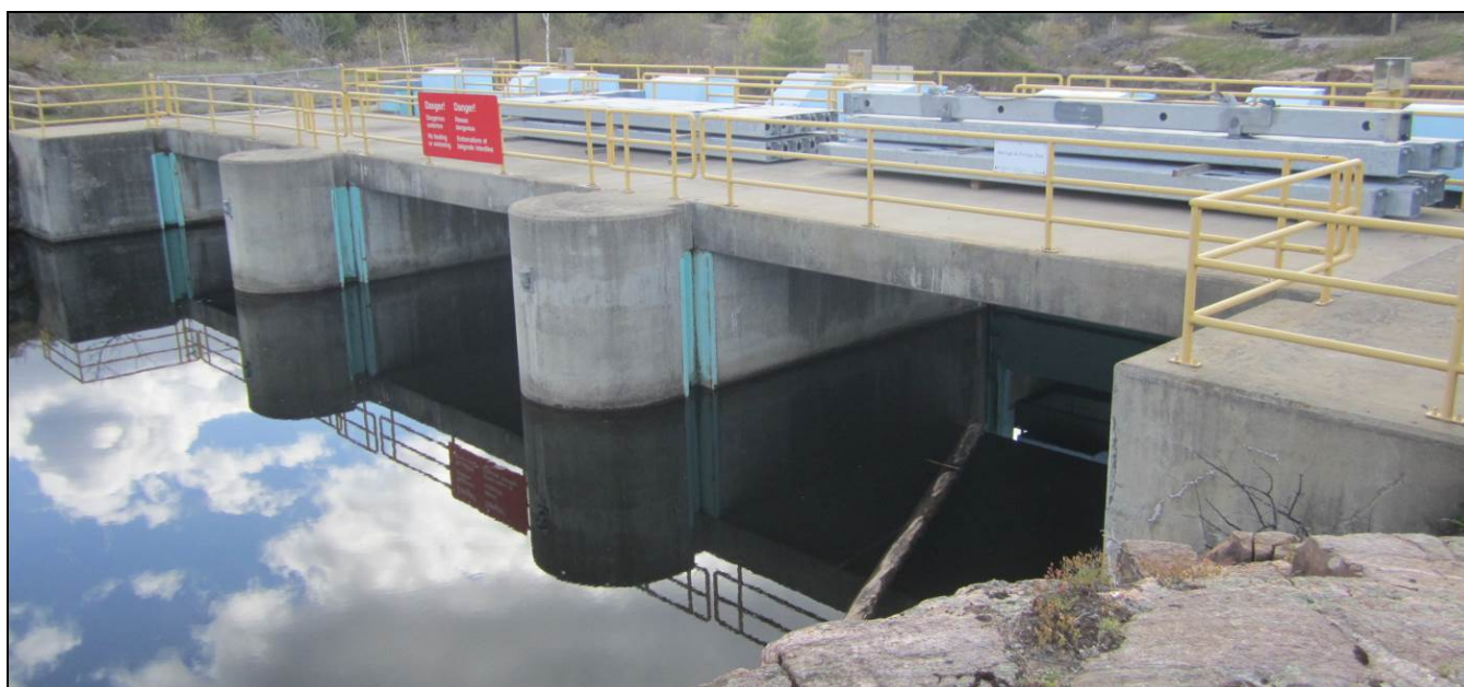
Figure 4 - Portage dam, upstream side. /// Barrage Portage, côté amont.