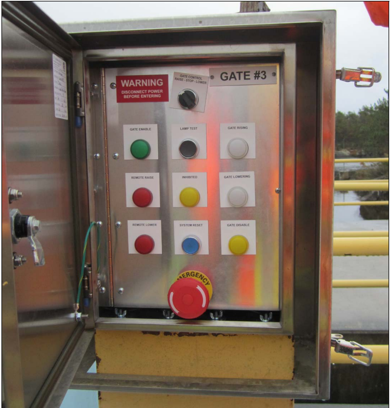
Figure 24 - Local control panel, Portage Dam. /// Panneau de contrôle local, barrage Portage.