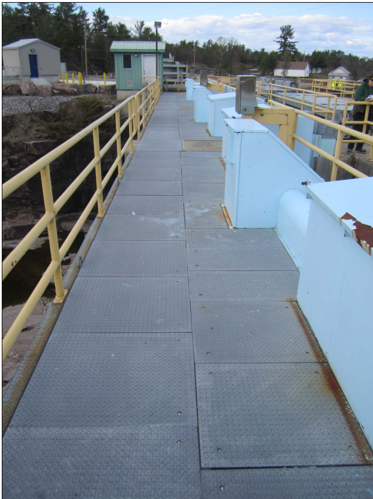
Figure 8 - Mechanical deck of Portage Dam, looking towards right abutment. /// Tablier mécanique du barrage Portage, vue en regardant vers la culée droite.