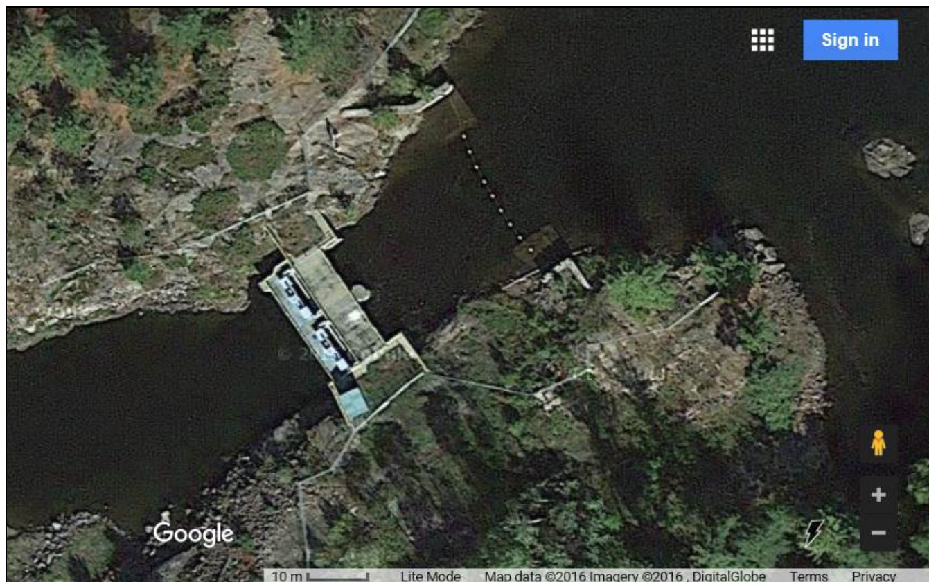
Figure 2 - Satellite view of Little Chaudière Dam (Google Maps). /// Vue satellite du barrage Little Chaudière (cartes Google).