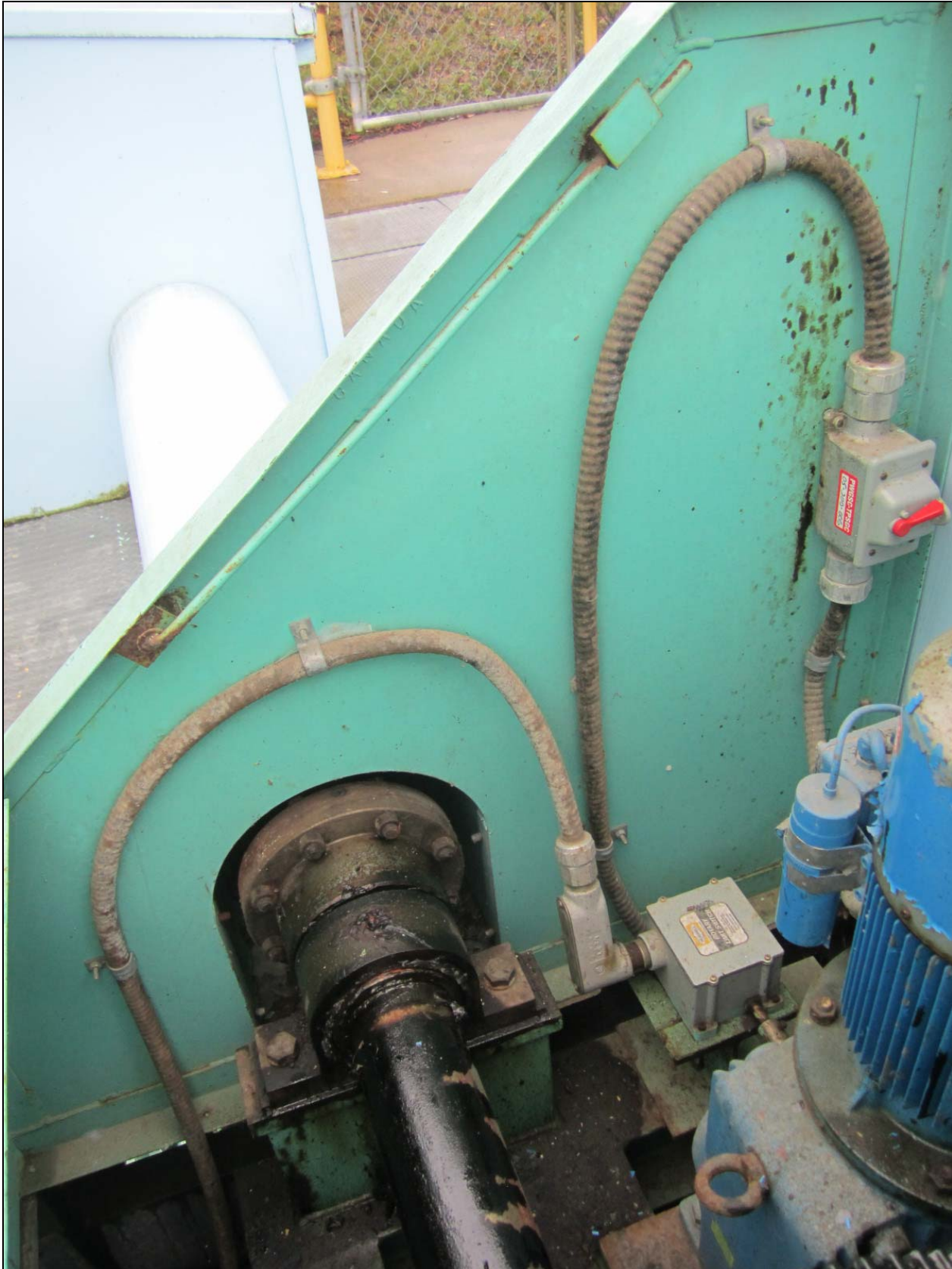
Figure 17 – Interior of hoist housing, Portage Dam. /// Intérieur du boîtier du treuil de vanne, barrage Portage.