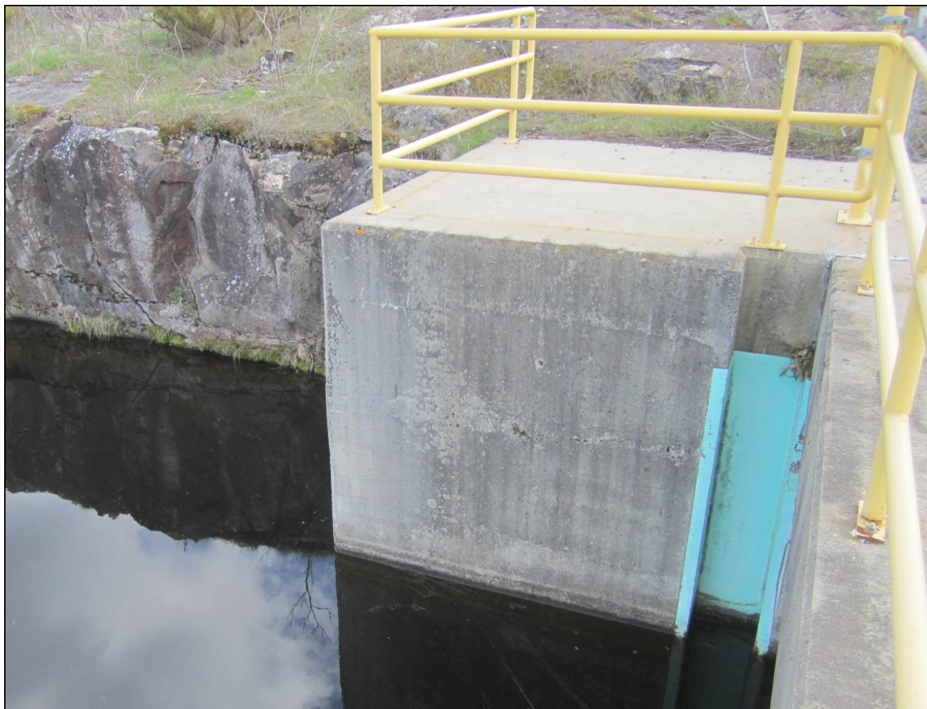
Figure 10 - Detail showing maintenance gains on upstream side of left abutment of Portage Dam. /// Détail montrant la rainure d'entretien dans la partie amont de la culée gauche du barrage Portage.