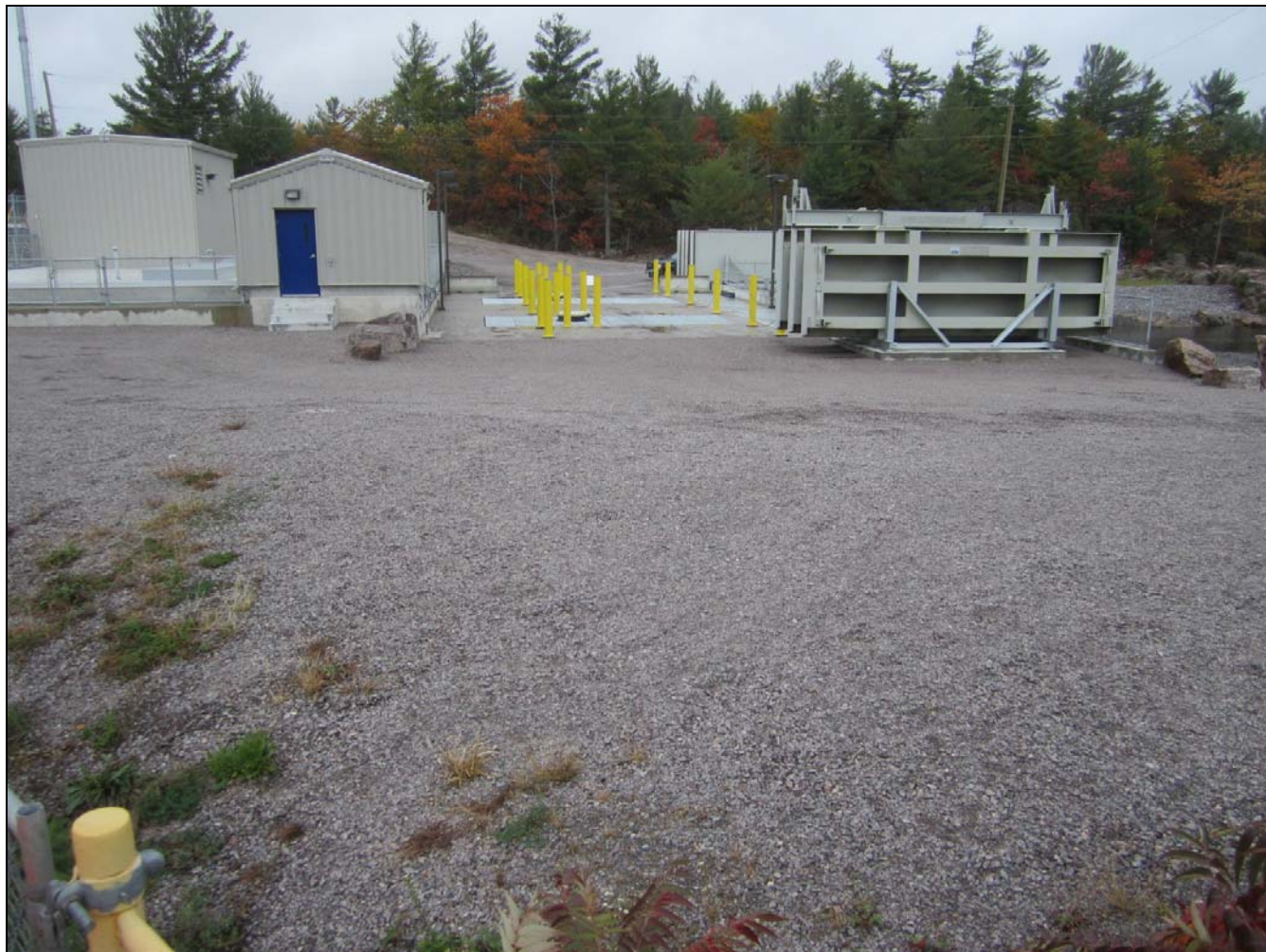
Figure 20 – Access to the Portage Dam through the site of the Okikendawt hydroelectric station. This photo taken from the deck of Portage Dam. /// Accès au barrage Portage à travers la station hydroélectrique Okikendawt. Photo pris du tablier du barrage Portage.