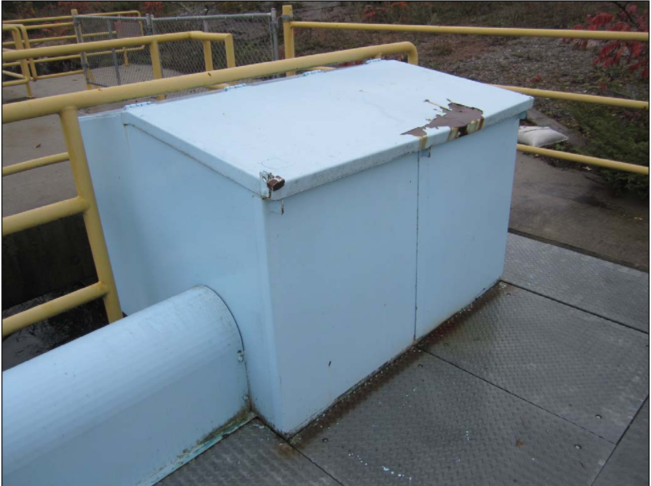
Figure 18 – Hoist drum housing, Portage Dam. /// Boîtier de tambour de treuil, barrage Portage.