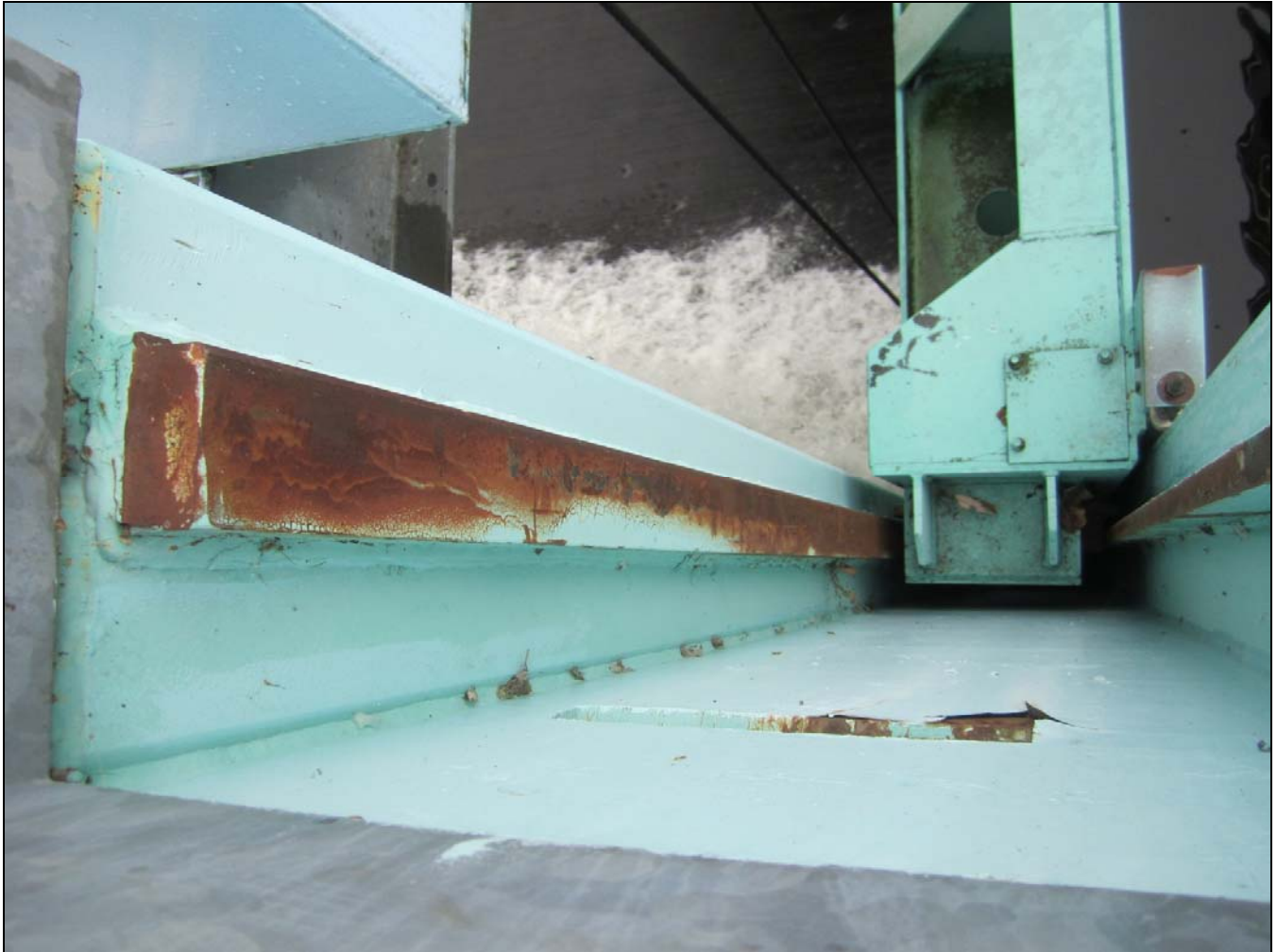
Figure 15 – Detail of gate in gain, Portage Dam. /// Détail d'une vanne dans sa rainure. Barrage Portage.