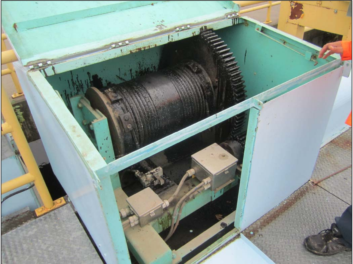
Figure 19 - Hoist drum, Portage Dam. /// Tambour de treuil, barrage Portage.