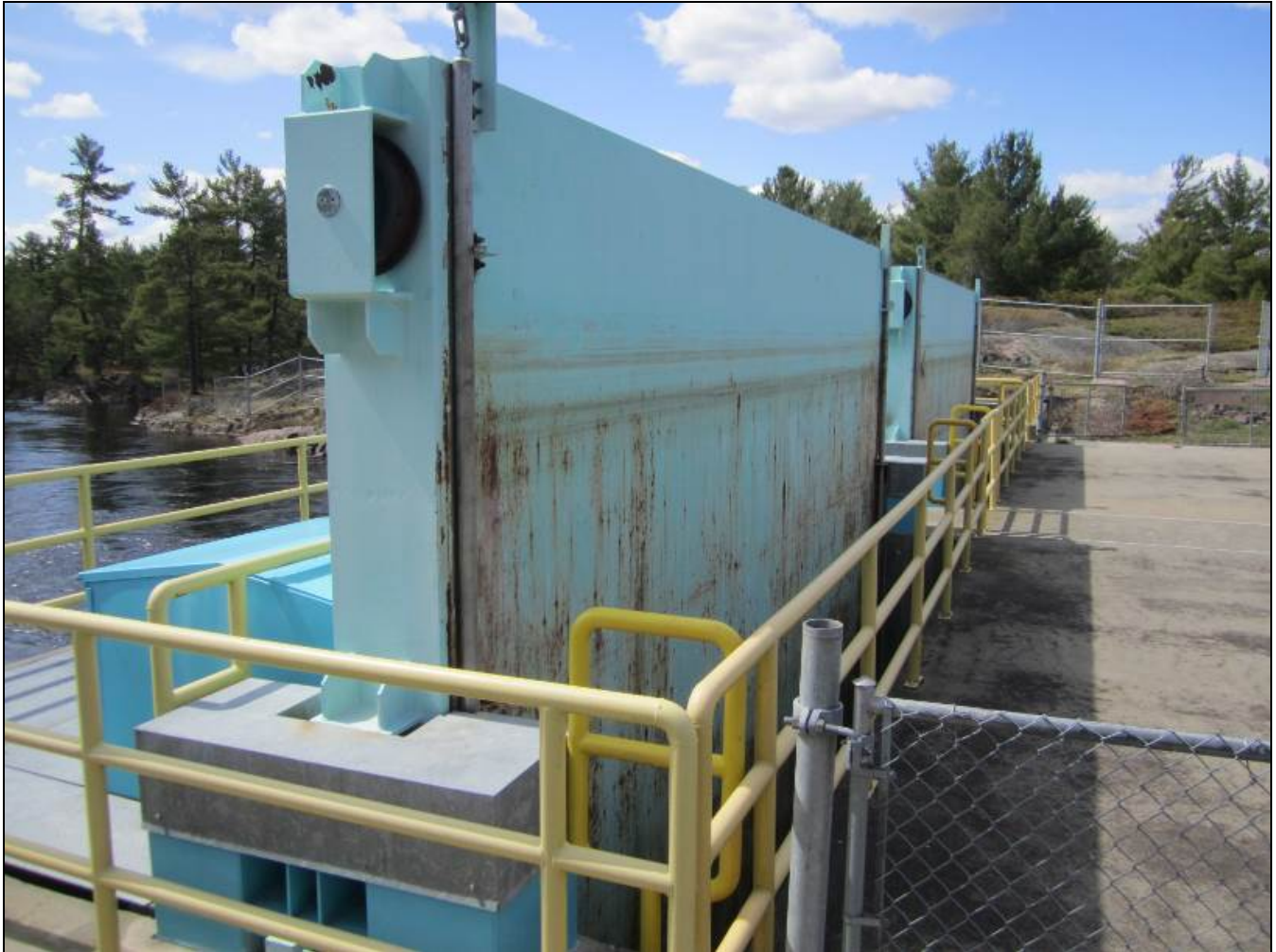
Figure 12 – Little Chaudière Dam with gates in fully open position. Upstream side of gates is shown. /// Barrage Little Chaudière avec les vannes en position ouverte. Vue montrant la surface amont des vannes.