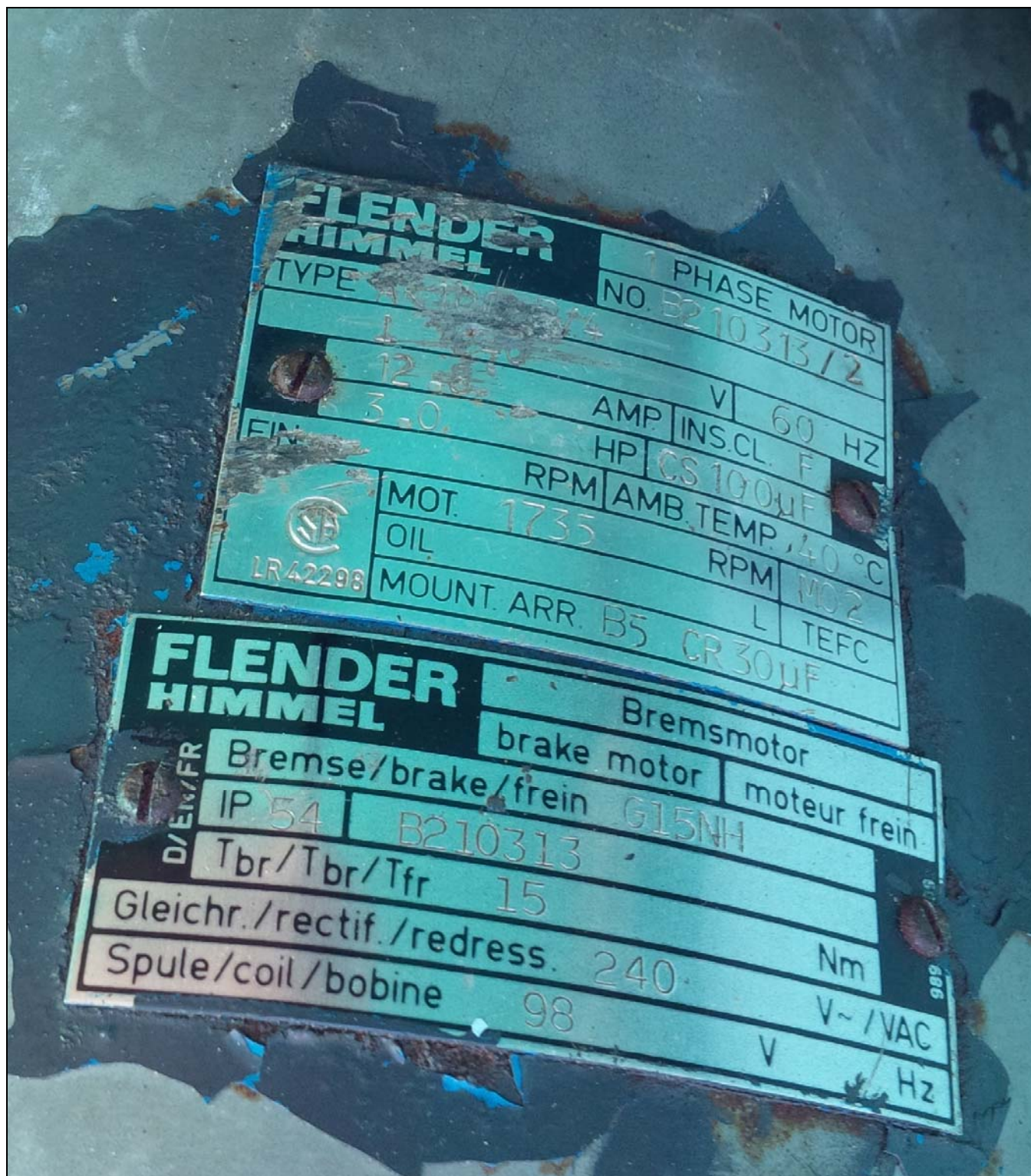
Figure 23 – Motor at Portage Dam. /// Moteur, barrage Portage.