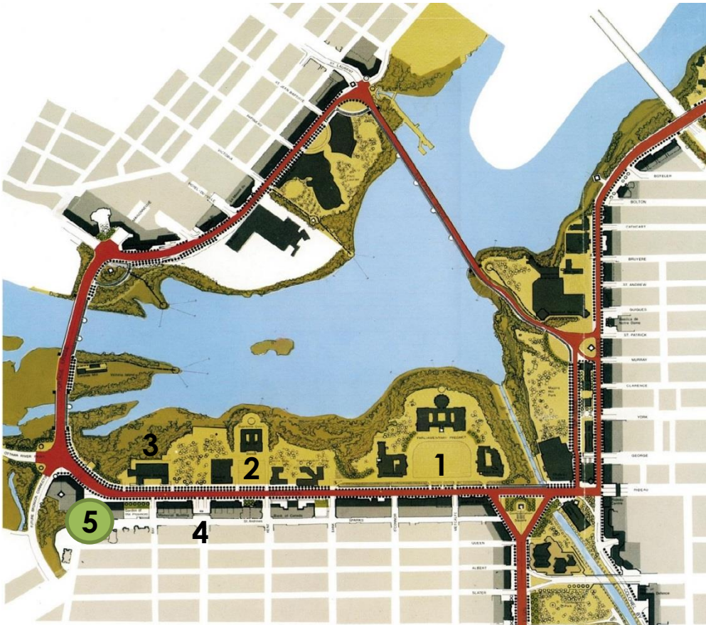
Plan du boulevard de la Confédération