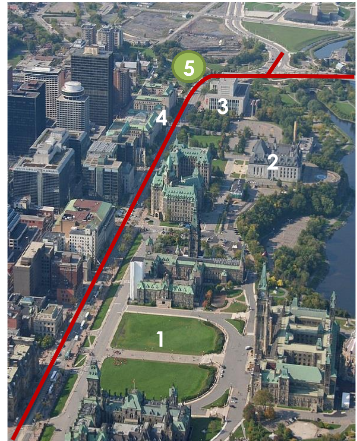
Le boulevard de la Confédération