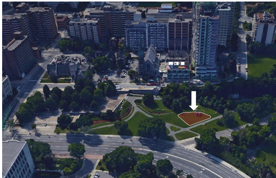
Site du monument

Veillez noter que la sculpture en bois de l'artiste Chung Hung, Douze points d'un équilibre classique , qui est présentement sur site, sera relocalisée.