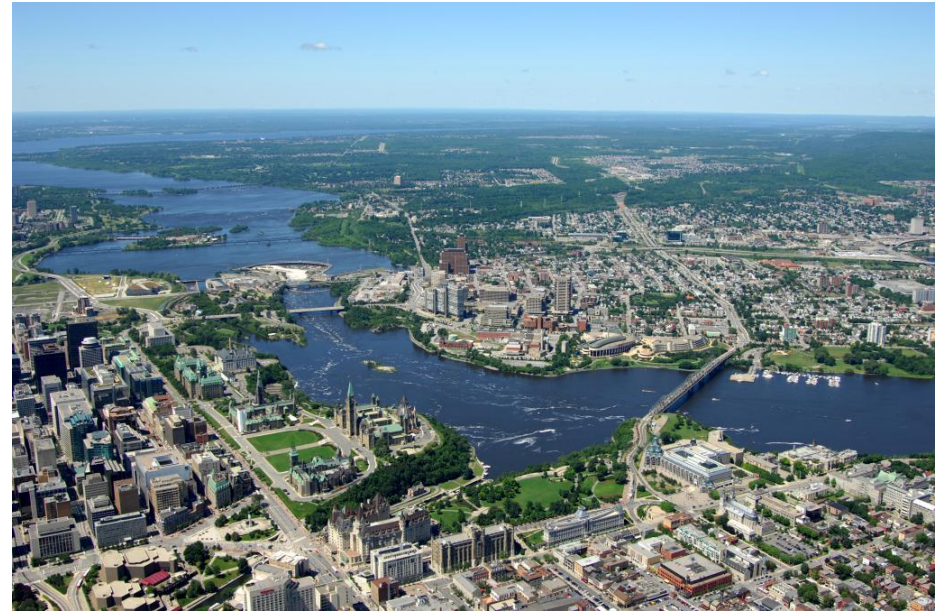
Vue à vol d'oiseau du cœur de la capitale du Canada

Le boulevard de la Confédération est le parcours cérémonial de la capitale, reliant bon nombre des attractions et symboles nationaux au moyen d'une approche esthétique unifiée et distincte. Cette voie de découverte se trouve dans le secteur du cœur de la capitale et il entoure les secteurs du centre-ville des villes d'Ottawa et de Gatineau de part et d'autre de la rivière. Le site du monument se trouve sur le boulevard de la Confédération à l'ouest des cités parlementaire et judiciaire. Son emplacement bien en vue en assurera une bonne visibilité à des milliers de visiteurs et de résidents du secteur du cœur de la capitale du Canada.