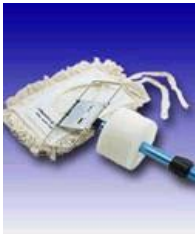
Outil de lavage de murs Geerpres

L'équipement qui convient le mieux aux petites opérations de lavage de murs consiste en un petit tampon monté sur un manche, comme celui vendu par Geerpres. Comme le nettoyage à l'aide de chiffons en microfibre s'effectue bien avec un outil de lavage de murs, vous pouvez proposer le type de système que vous préférez. Il n'est toutefois pas garanti que nous l'approuverons.