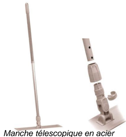
Manche télescopique en acier