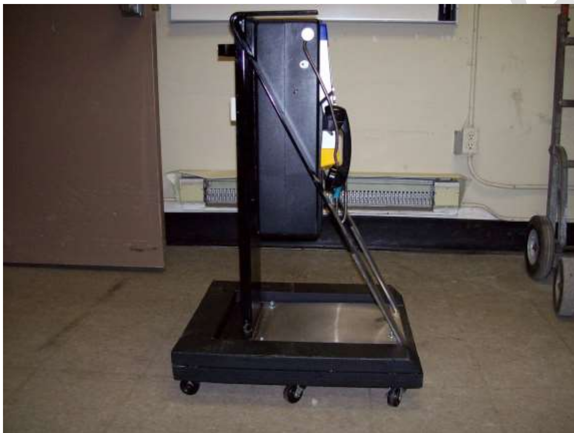
Figure 5 – Exemple de chariot pour le secteur d'isolement