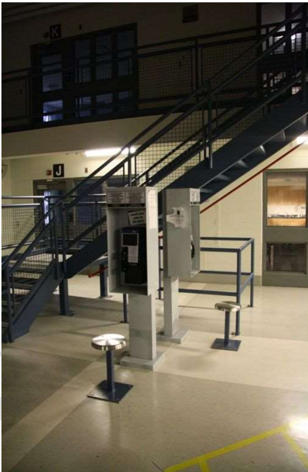
Figure 3 – Exemple de cabines autoportantes