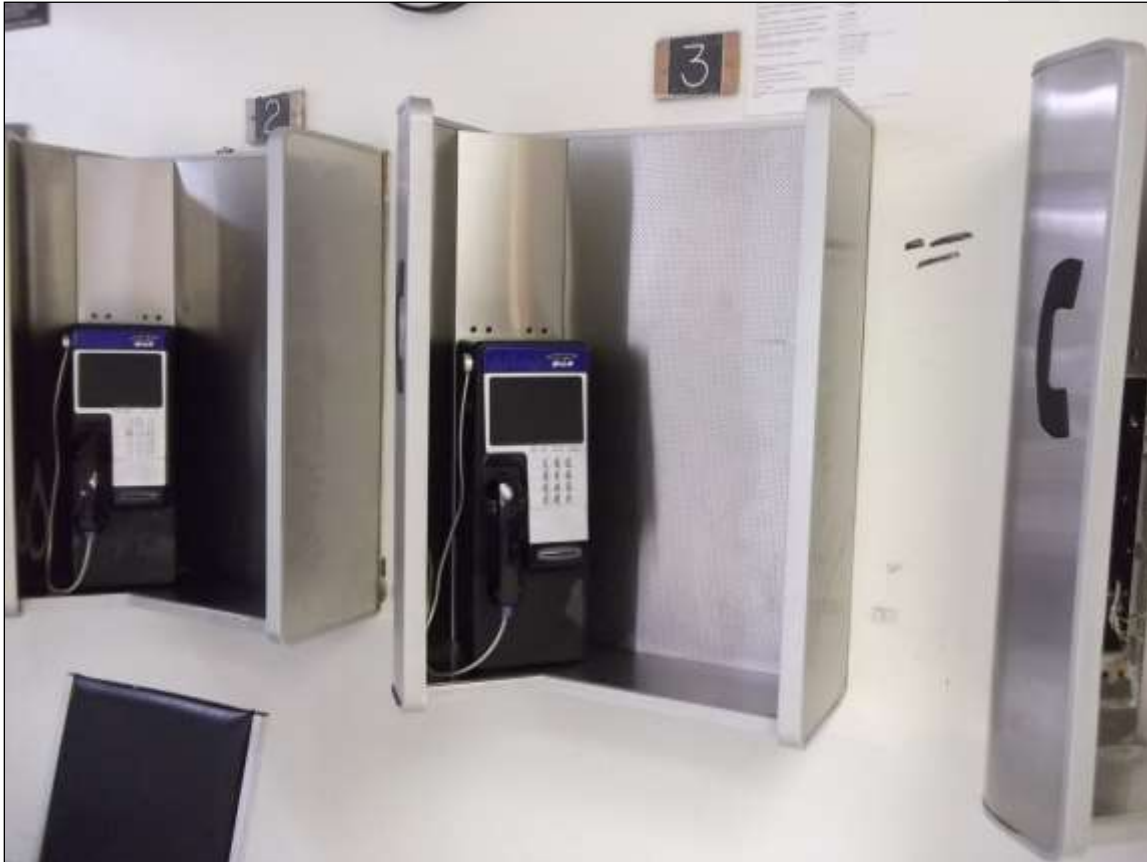
Figure 1 – Exemple de cabines fixées au mur

Les photographies suivantes constituent des exemples de cabines téléphoniques pour les détenus qu'on peut retrouver dans certains établissements. Ces exemples sont présentés à titre indicatif seulement. Chacun des établissements du SCC peut avoir des cabines qu'il souhaite conserver ou avoir besoin de cabines fournies par l'entrepreneur.