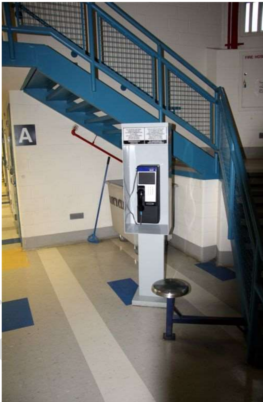
Figure 2 – Exemple de cabine autoportante