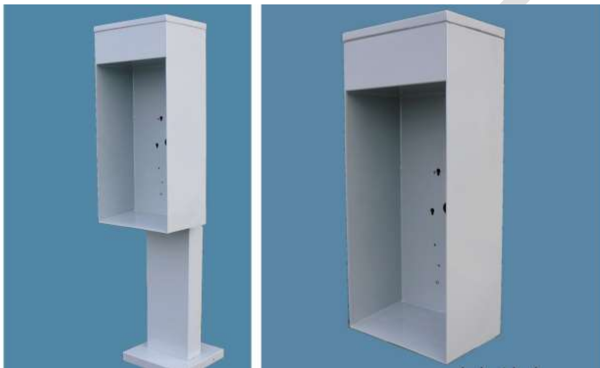
Figure 4 – Exemple de cabine autoportante et de cabine fixée au mur