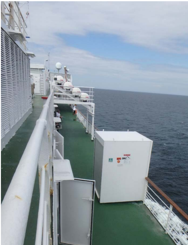
Figure1 : Moxie MES, sur la terrasse de bateaux

Les deux (2) nouveaux DEM complets avec des câbles, des treuils de mise à la mer, des fils et des poulies doivent pouvoir être installés à un endroit semblable à celui des unités du DEM existantes, situées sur le pont des embarcations, à bâbord et à tribord (environ au secteur 66).