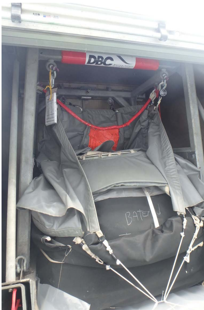
Figure2 : chute, avec porte ouverte ouverte

Numéro de document : 13441315 Version : 1