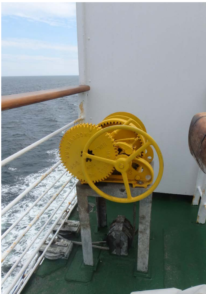
Figure3 : treuil bowsing avec poulies verticales et horizontales

Les seize (16) radeaux de sauvetage DBC actuels situés de chaque côté des DEM sur le pont de navigation, soit huit (8) à bâbord et huit (8) à tribord, doivent être remplacés. Actuellement, quatre (4) supports de mise à l'eau sont soudés aux ponts par quatre canaux carrés (deux sur le pont du bâtiment et deux sont le pont de navigation) et quatre platebandes/bases ( voir la figure 4 ). L'entrepreneur doit indiquer si les râteliers de mise à l'eau des radeaux de sauvetage existants sont recommandés en prévision d'une réutilisation avec les nouveaux radeaux de sauvetage à fournir.