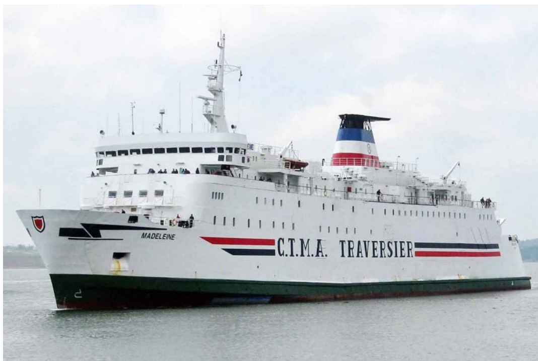
GROUPE CTMA | MADELEINE