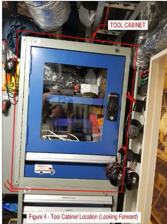
Figure 4: emplacement armoire d'outils (regarder vers l'avant)