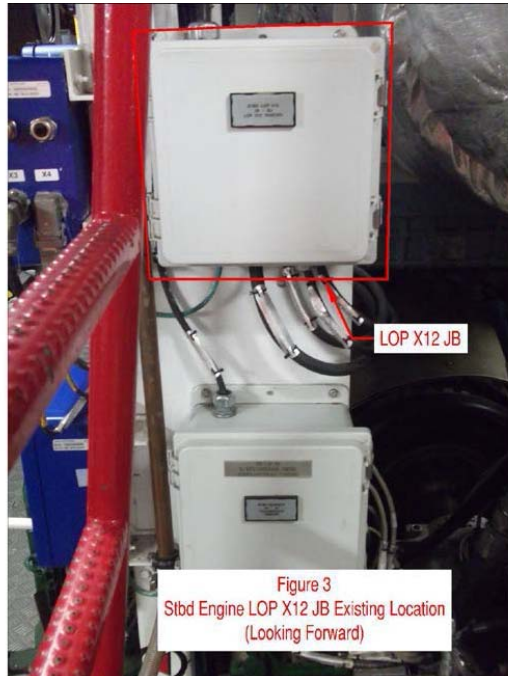
Figure 3: moteur tribord LOP X12 boîte de jonction existante regarder vers l'avant