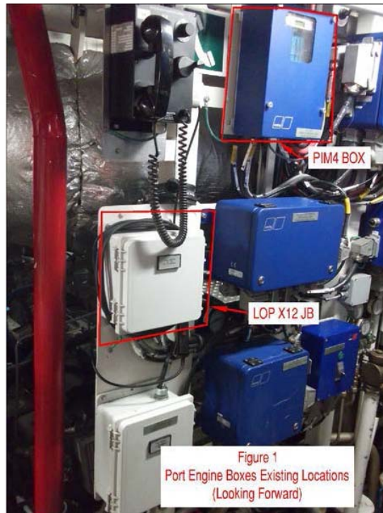
Figure 1: emplacement actuel moteur bâbord (regardant vers l'avant)