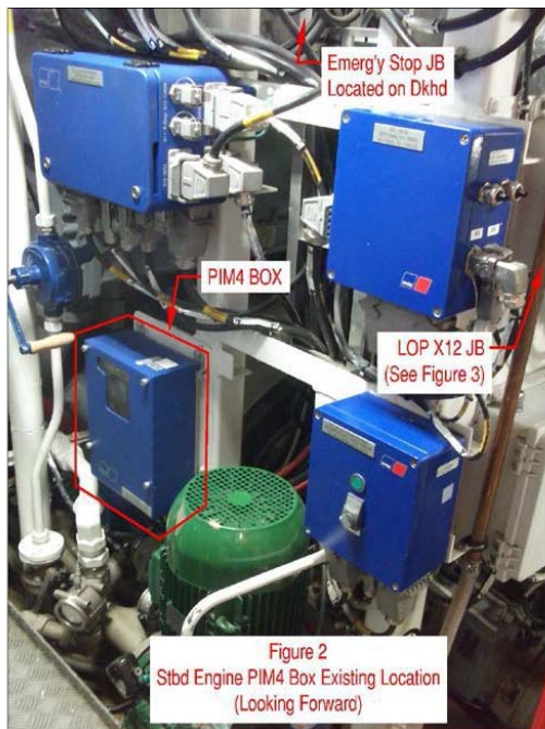
Figure 2: Stbd Engine PIM 4 Box position actuelle regarder vers l'avant