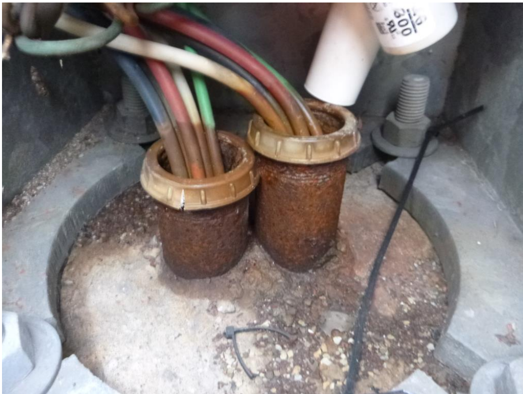
Donnacona – Intérieur caisson/Interior box