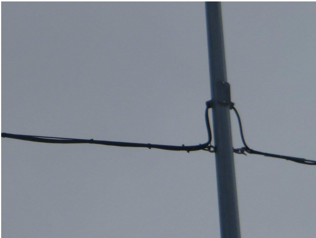
Attache inférieure et câble électrique/Lower attachment and electric cable