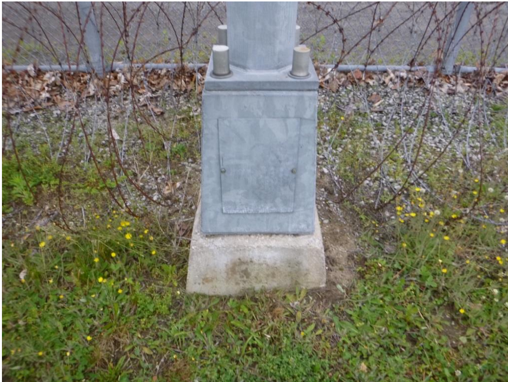
Donnacona – Base typique/Typical base