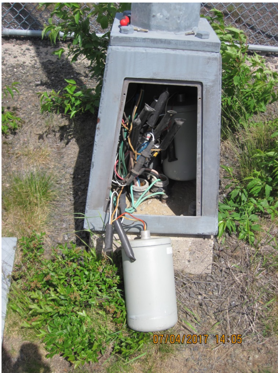
Port-Cartier – Intérieur caisson/Interior box