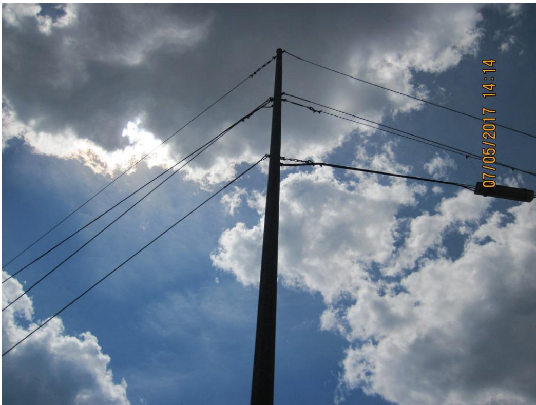
Poteau de coin/Corner post