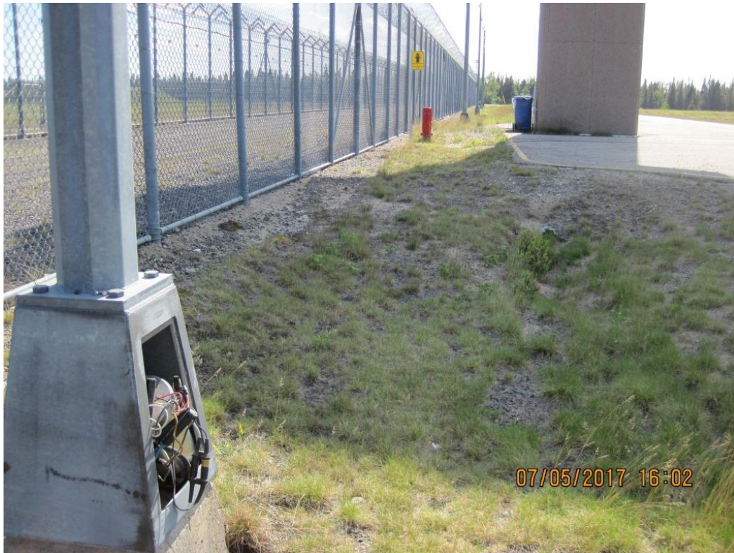
Port-Cartier—Base typique/Typical base

Pictures for replacement of perimeter Lighting project Donnacona and Port-Cartier