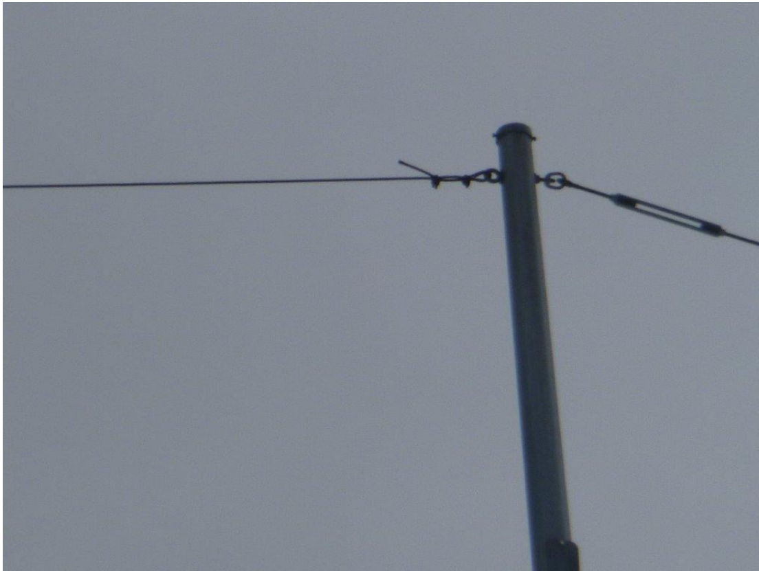
Attache supérieure/Upper attachment