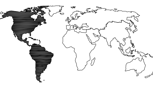
americas region | régions des amériques

CANADIAN HIGH COMMISSION / EMBASSY OFFICE SPACE CITY COUNTRY NAME AND ADDRESS OF PROPERTY