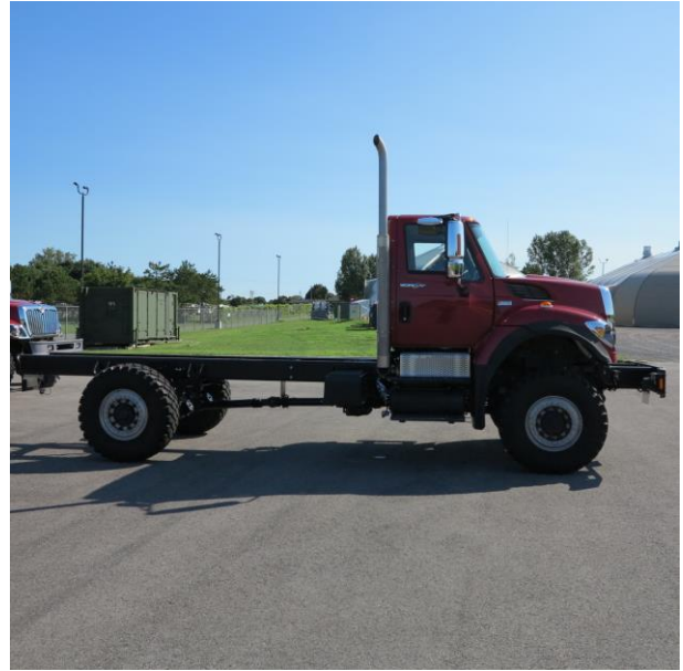
Variant 1 Passenger side Variante 1 Côté conducteur