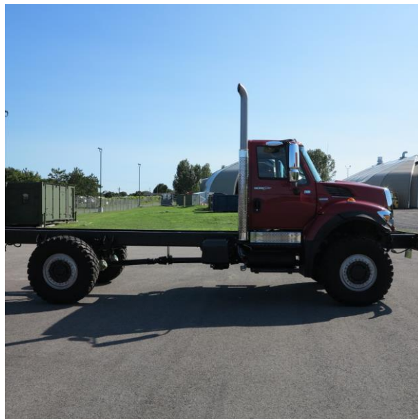
Variant 2 Passenger side Variante 2 Côté conducteur