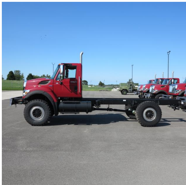
Variant 2 Driver side Variante 2 Côté conducteur