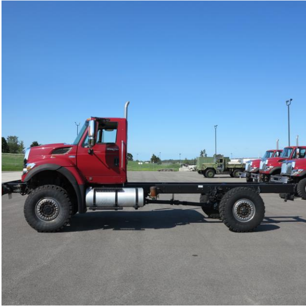
Variant 1 Driver side Variante 1 Côté conducteur