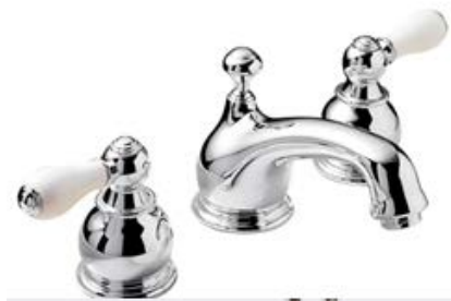
Image 18 – Robinet de la demi-salle de bains et de la salle de bains, à titre de référence