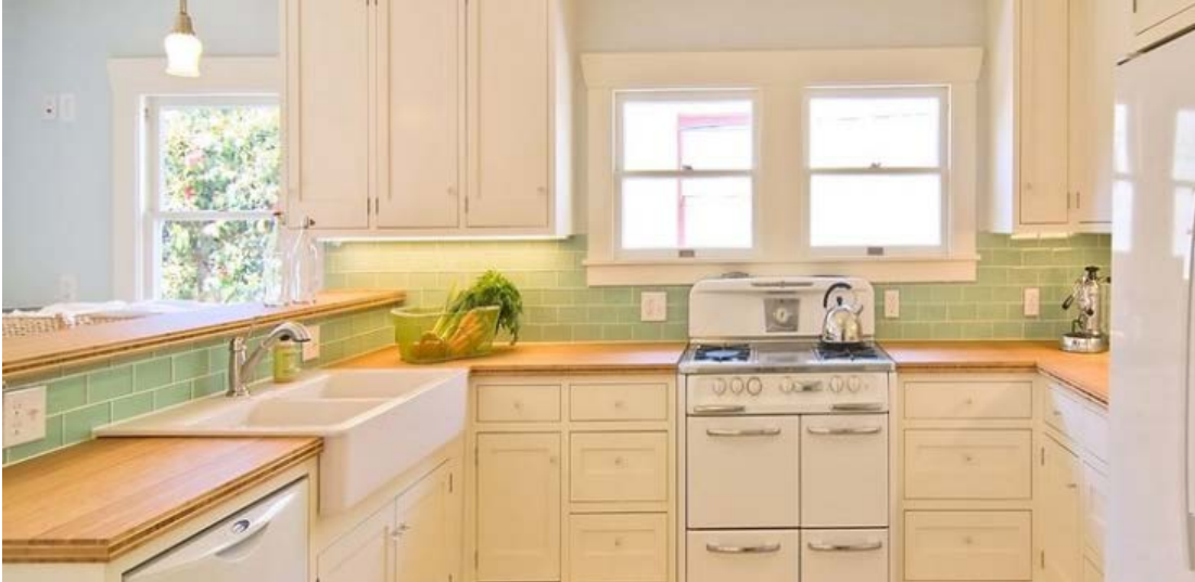
Image 5 – Carreaux de céramique de couleur vert doux dans la cuisine, à titre de référence