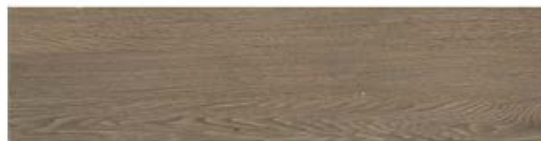
Image 4 – Carreau de céramique à imitation de bois, à titre de référence