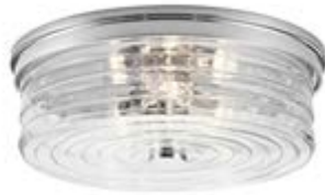
Image 10 – Plafonnier, à titre de référence, pour la demi-salle de bains et la salle de bains