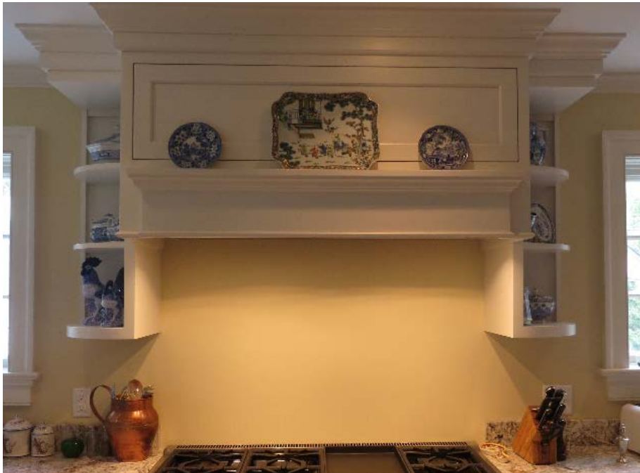
Image 16 – Couverture de ventilateur de hotte de four, à titre de référence

Couvercle de ventilateur de hotte de four avec panier à assiettes et tablettes en angle de chaque côté (carreaux de couleur vert doux à installer comme dossierer jusqu’au revêtement mural).