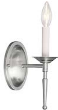
Image 9 – Applique, à titre de référence, pour la demi-salle de bains et la salle de bains