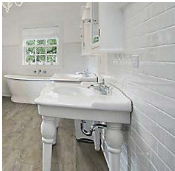
Image 6 – Carreaux de céramique blanc pour la salle de bains au 2 e étage, à titre de référence