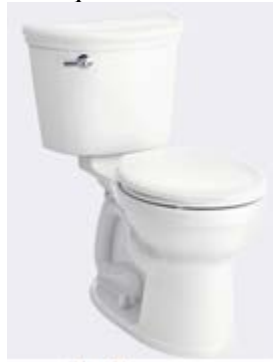
Image 19 – Toilette de la demi-salle de bains et de la salle de bains, à titre de référence