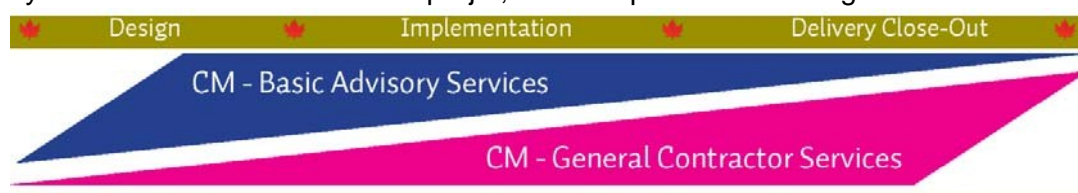
Figure 1 – Niveau d'effort