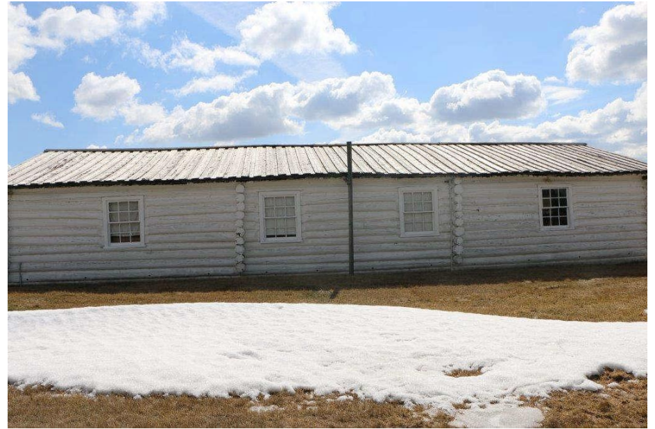
Caserne des sous-officiers – Élévations extérieures (mars 2019)