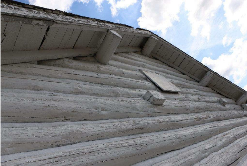
Palais de justice/ grenier à céréales – dessous du soffite à l'extrémité du pignon. (mars 2019))