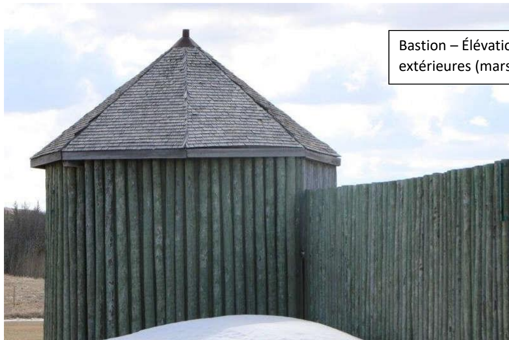
Bastion – Élévations extérieures (mars 2019)