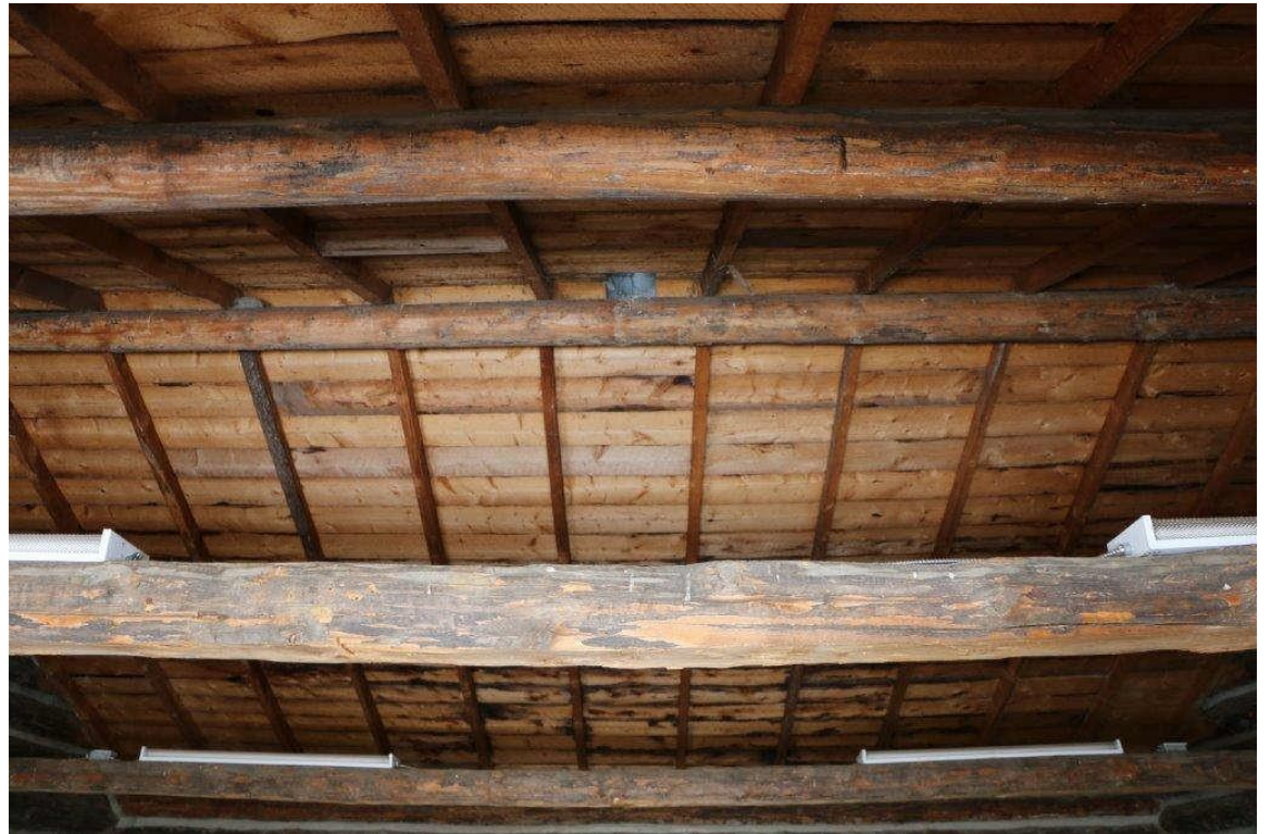
Palais de justice/ grenier à céréales – Dessous intérieur du plafond/toit. (mars 2019)