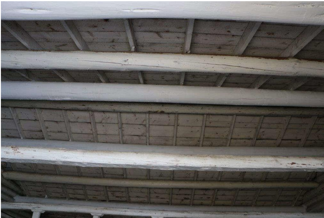
Écurie - Structure de plafond apparente intérieure (mars 2019)