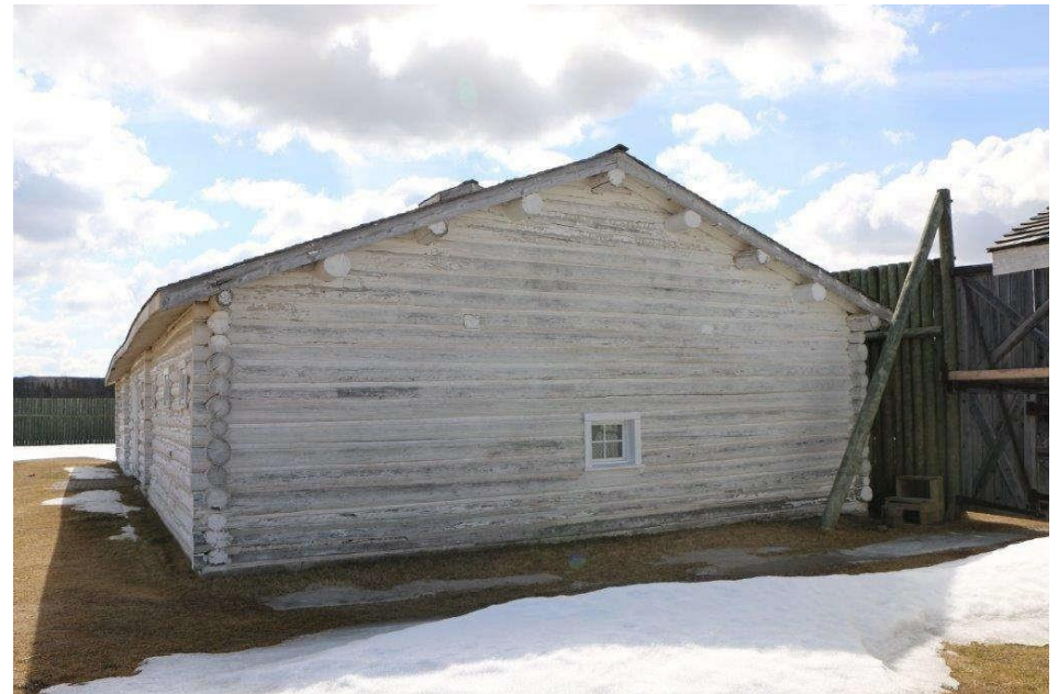
Écurie - Élévations extérieures et gros plan des soffites/fascia à l'extrémité du pignon. (mars 2019)