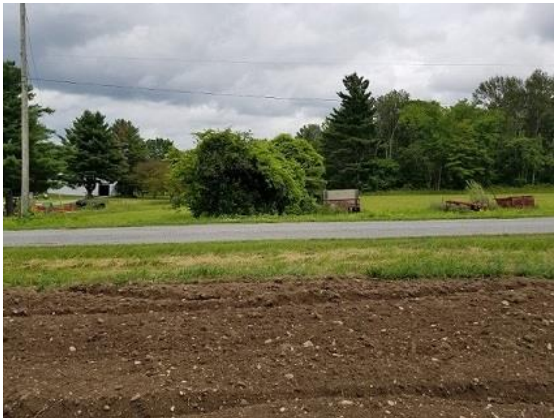
Vue vers l'EST