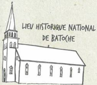
LIEU HISTORIQUE NATIONAL DE BATOUCHE

Tu peux t'amuser dans plusieurs endroits de Parcs Canada! Visite parcscanada.gc.ca/xplorateurs pour découvrir où ils sont situés.