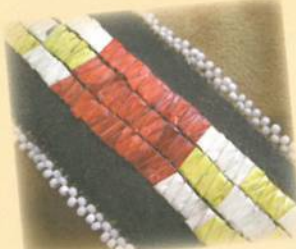
Lakota les couleurs principales sont le rouge, le jaune et le noir