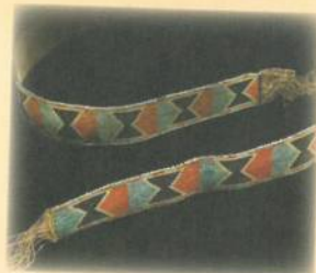
Dene zigzags et losanges