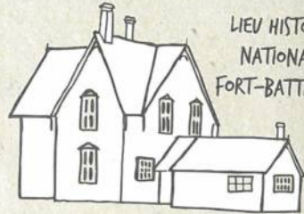
LIEU HISTORIQUE NATIONAL DU FORT-BATTLEFORD