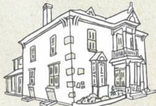
LIEU HISTORIQUE NATIONAL DU HOMESTEAD-MOTHERWELL