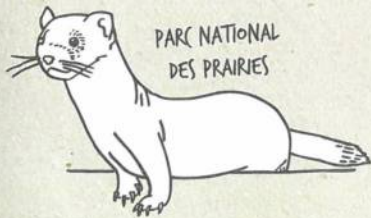
PARC NATIONAL DES PRAIRIES