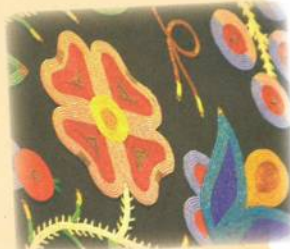
Métis motifs floraux