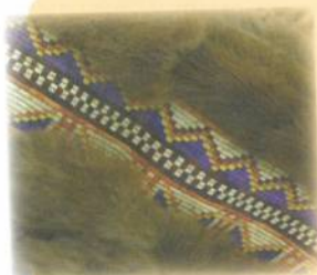
Cris des plaines formes géométriques colorées

Plusieurs Autochtones pratiquent le perlage et le tissage. Plusieurs familles et communautés avaient des motifs distinctifs qui les représentaient. En voici quelques exemples :