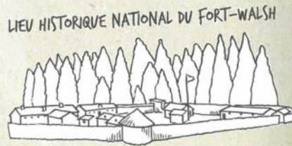
LIEU HISTORIQUE NATIONAL DU FORT-WALSH