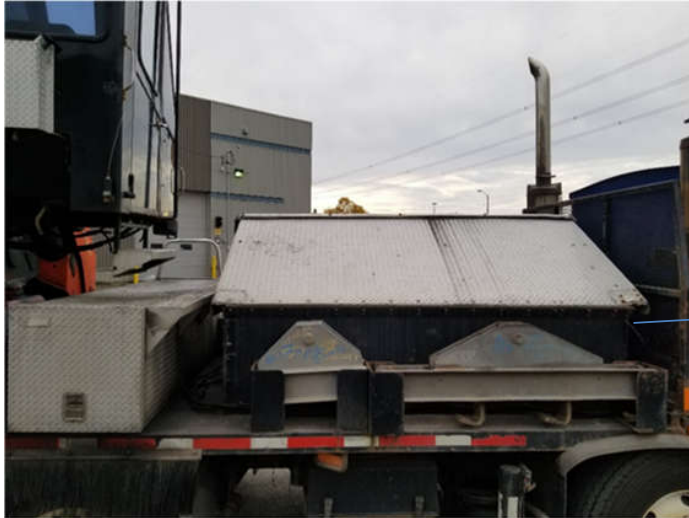
Photo de la boîte de poids étalons actuel et de son couvert

Photo de la boîte de poids du camion actuel.