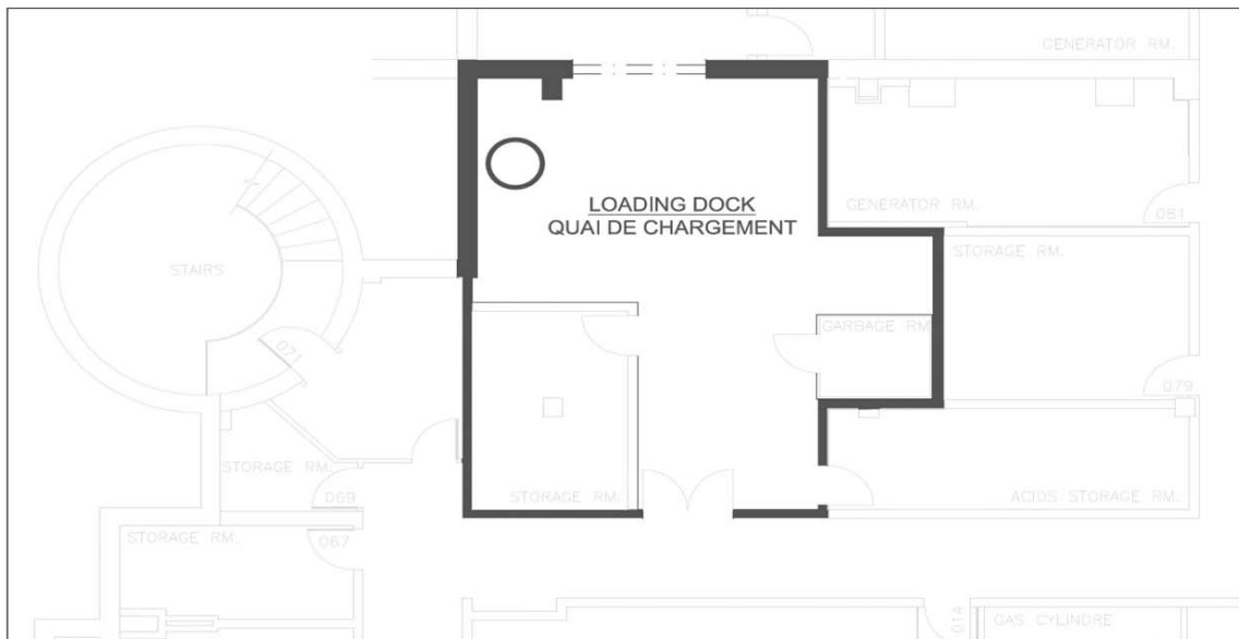
Sous-Sol | Basement