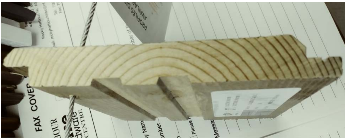
Figure 2. PHOTO DU PROFIL DE PAREMENT