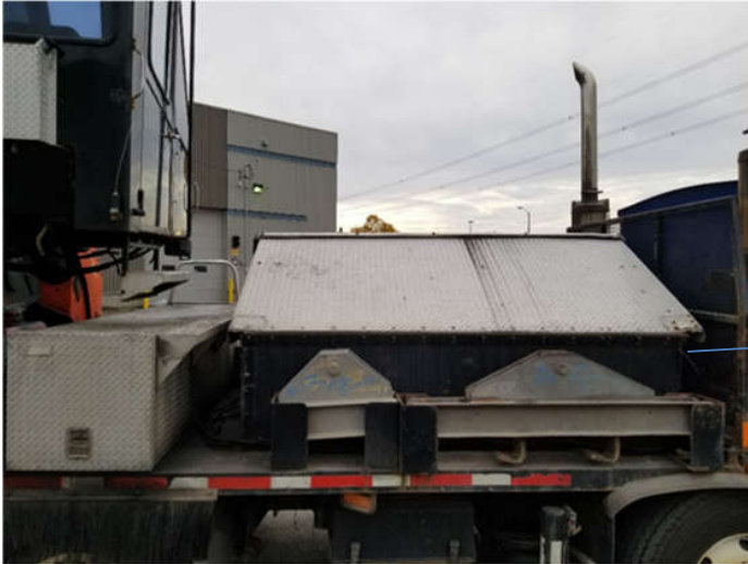
Photo de la boîte de poids étalons actuel et de son couvert

Photo de la boîte de poids du camion actuel.