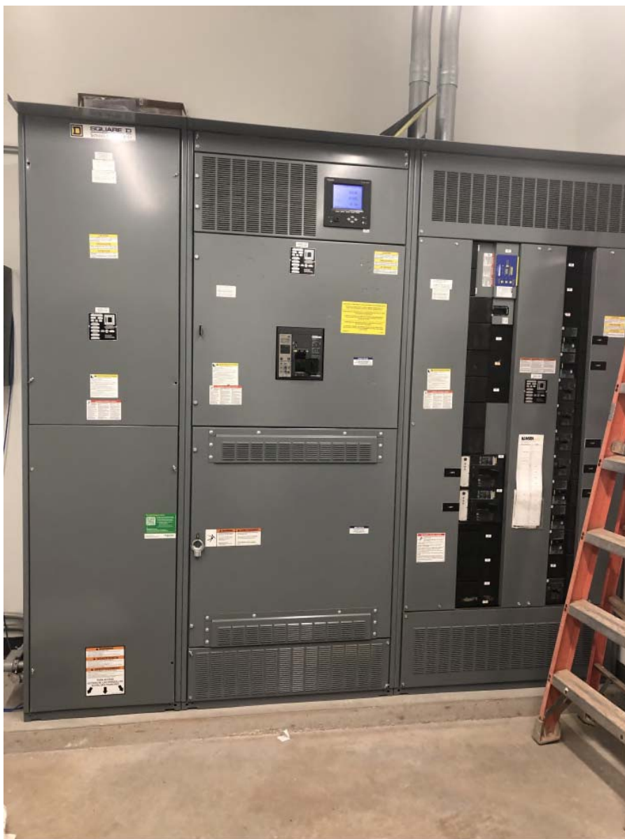
Visitor Centre Main Switchboard_ 2