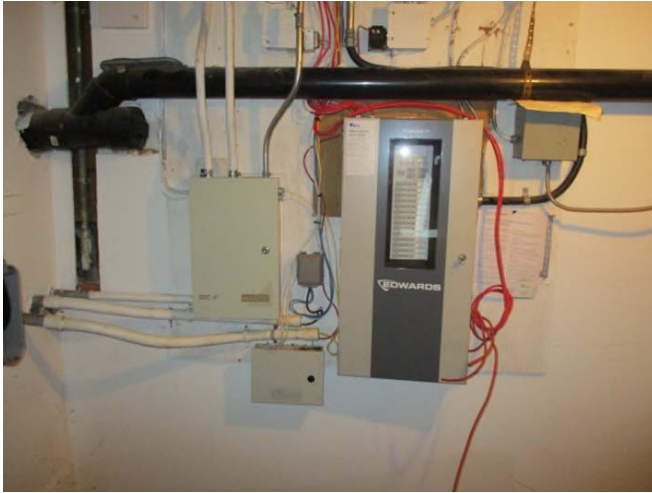
House Existing Fire Alarm Panel

Buyer ID - Id de l'acheteur PWC033 CCC No./N° CCC - FMS No./N° VME