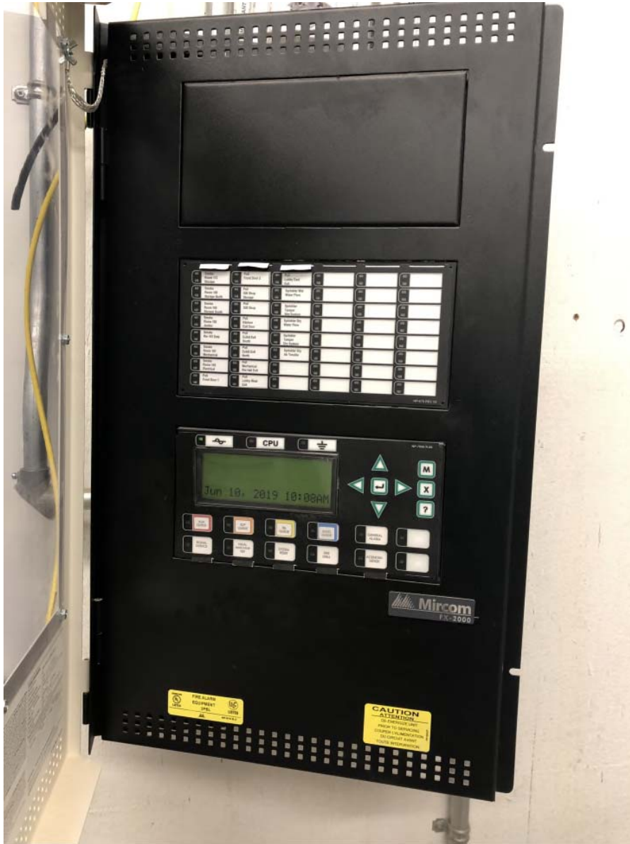
Visitor Centre Existing fire Alarm Panel