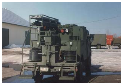
Variante de pose de câbles