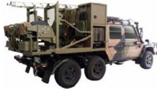
Exemples de trousse des véhicules d'équipement spécialisé pour la pose de câbles de pays alliés