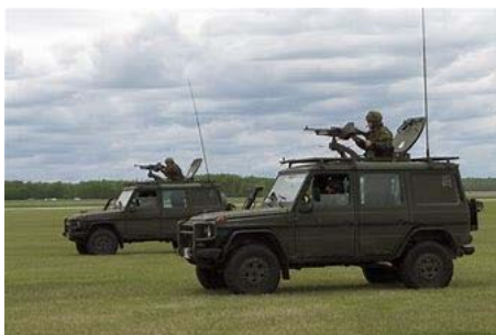
Variante C et R

La configuration à quatre sièges présente deux variantes : commandement et reconnaissance (C et R) et une variante de la Police militaire (PM), voir exemples ci-dessous des variantes actuelles en service :