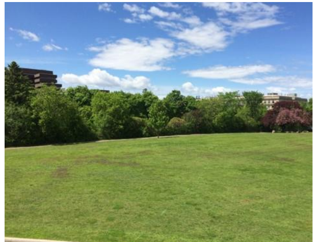
Vue du site en regardant vers l'édifice Pearson