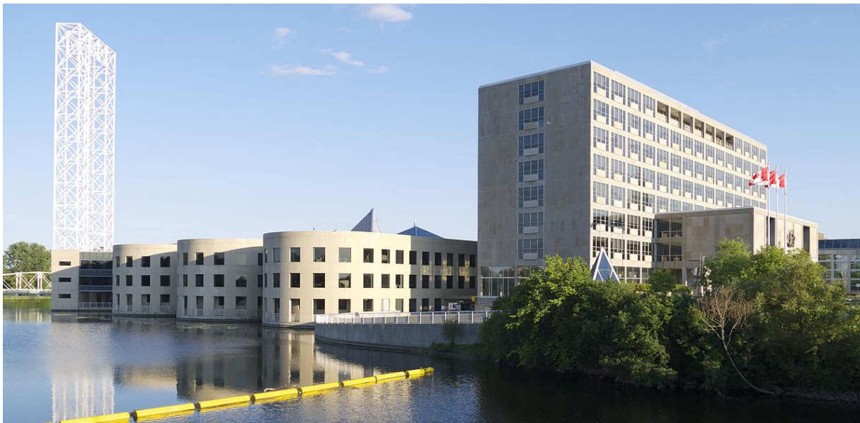
Vue de l'Édifice Diefenbaker depuis le nord

Moshe Safdie lui a conçu une importante annexe, qui a logé l'hôtel de ville d'Ottawa jusqu'en 2001. La même année, l'ensemble s'est ajouté au Répertoire canadien des lieux patrimoniaux. L'édifice appartient maintenant au gouvernement fédéral et accueille Affaires mondiales Canada.