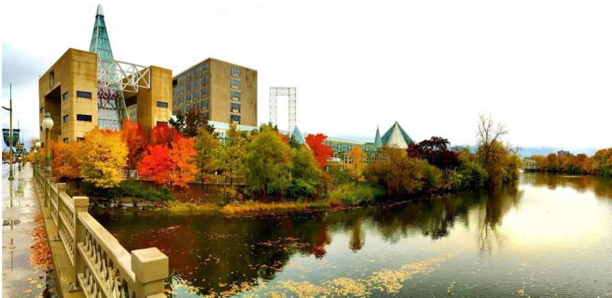
Vue de l'Édifice Diefenbaker depuis le sud et en regardant vers le site