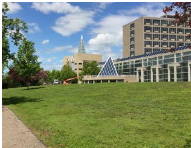
Vue du site en regardant vers l'édifice Diefenbaker