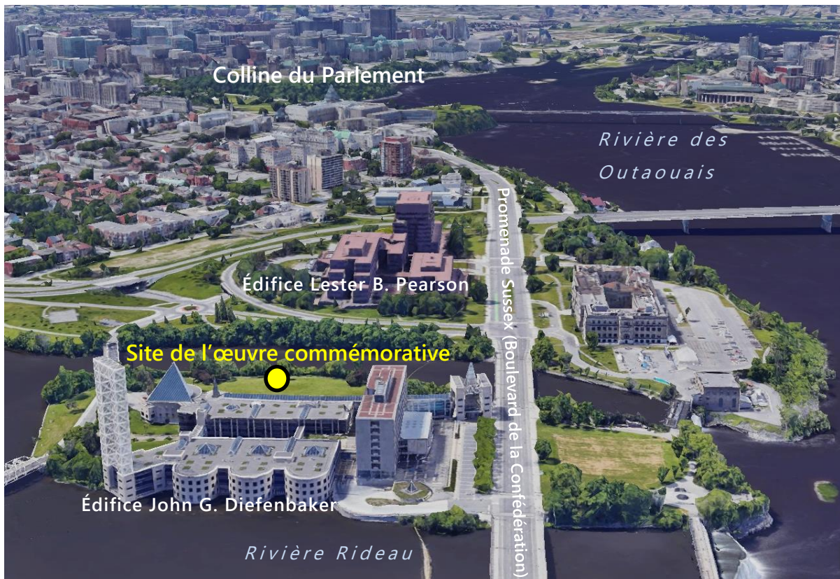
Vue à vol d'oiseau de l'emplacement de l'œuvre d'art commémorative en regardant vers la Colline du Parlement

D'autres points de repère importants du secteur sont en grande partie liés à la rivière Rideau et à sa confluence avec la rivière des Outaouais. Les principaux sont les chutes Rideau, les ponts Minto et plusieurs parcs publics liés aux deux rivières.