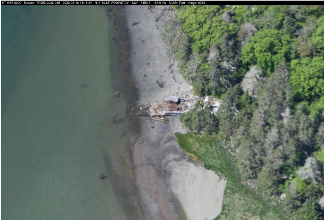
Le Bernard N. Seeley échoué (Juin 2020)