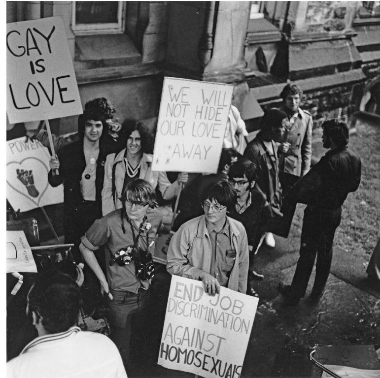
Manifestation « We Demand », Colline du Parlement, 1971 1971

Le règlement prévoyait des fonds pour des mesures de réconciliation et de reconnaissance. Plus précisément, le règlement exige la création d'un Monument national LGBTQ2+ devant reconnaître la discrimination historique subie par les personnes LGBTQ2+ au Canada, y compris les victimes de la Purge LGBT.