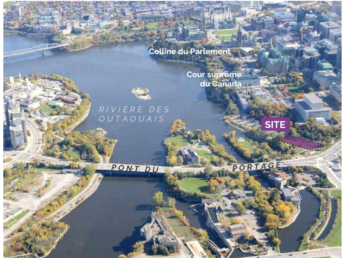
Vue en plongée de l'emplacement du Monument