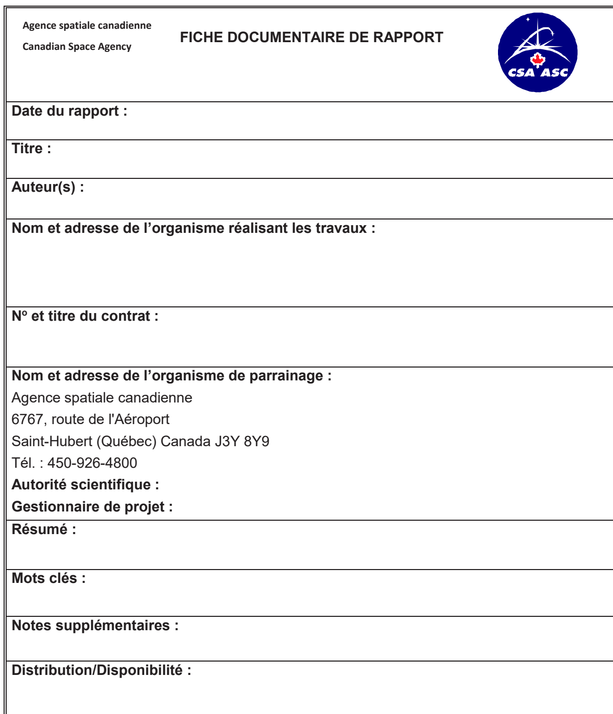
Tableau A-2-1: Gabarit de fiche documentaire de rapport