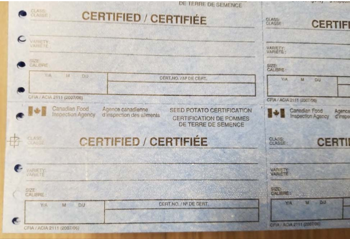
Blue Certified Tag Back