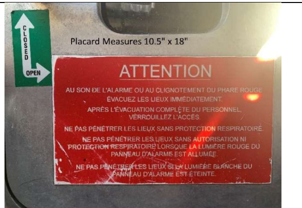
Placard Measures 10.5" x 18"