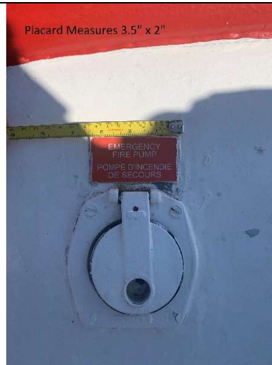
Placard Measures 3.5" x 2"

Sign to be made to read vertically for this location.