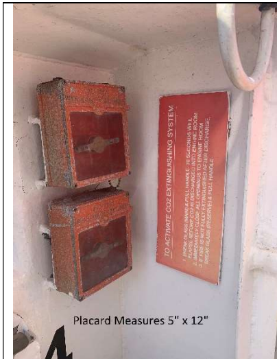
Placard Measures 5" x 12"

Sign to be made to read vertically for this location.