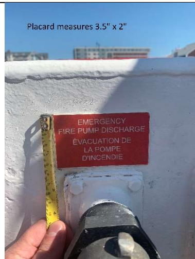
Placard measures 3.5" x 2"