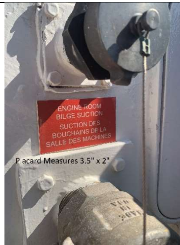
Placard Measures 3.5" x 2"