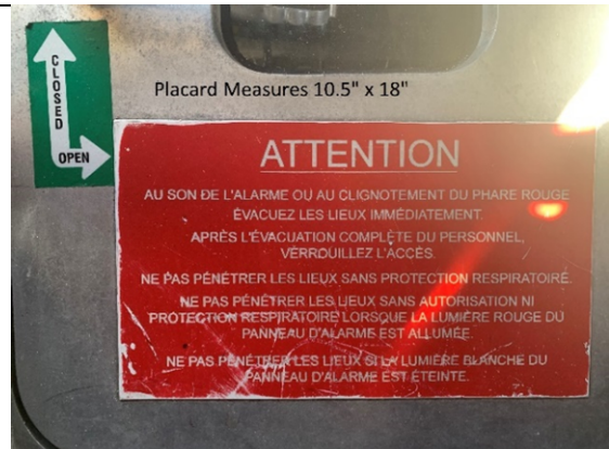
Placard Measures 10.5" x 18"