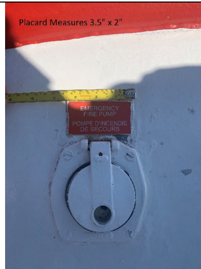
Placard Measures 3.5" x 2"

Sign to be made to read vertically for this location.