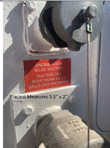
Placard Measures 3.5" x 2"