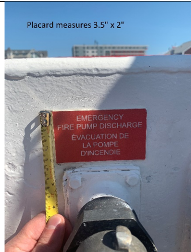
Placard measures 3.5" x 2"