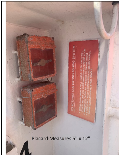
Placard Measures 5" x 12"

Sign to be made to read vertically for this location.