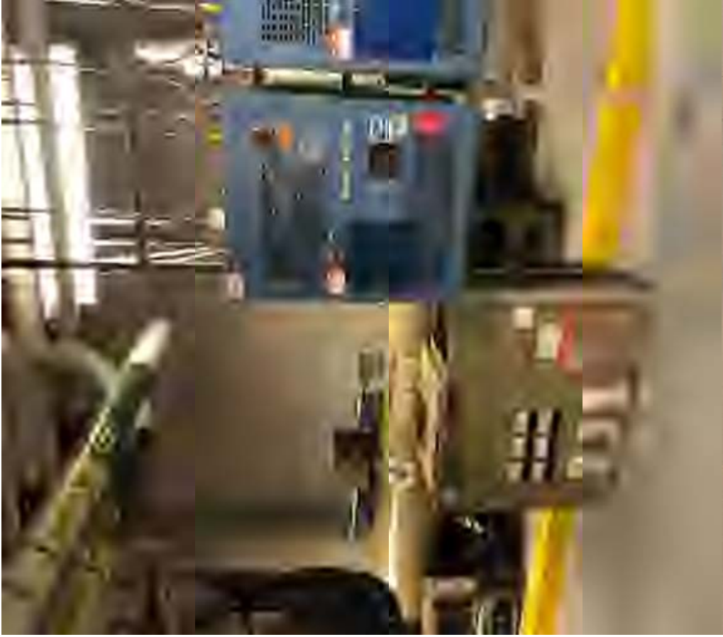
Figure 7 – Chiller #3 Existing Condition / Condition existante du refroidisseur no.3 – Room / salle 111