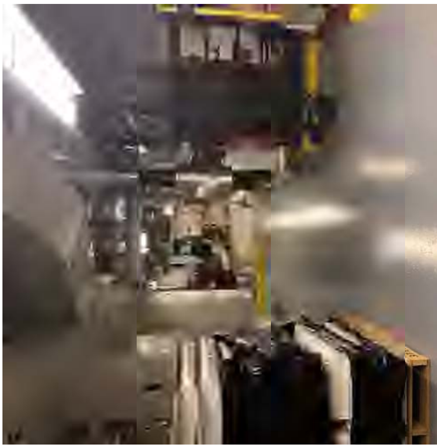
Figure 6 – Chiller Entry Path – Facing South towards Chiller #3 / Entrée du - refroidisseur – En regardant vers le sud, face au refroidisseur – Room / salle 111