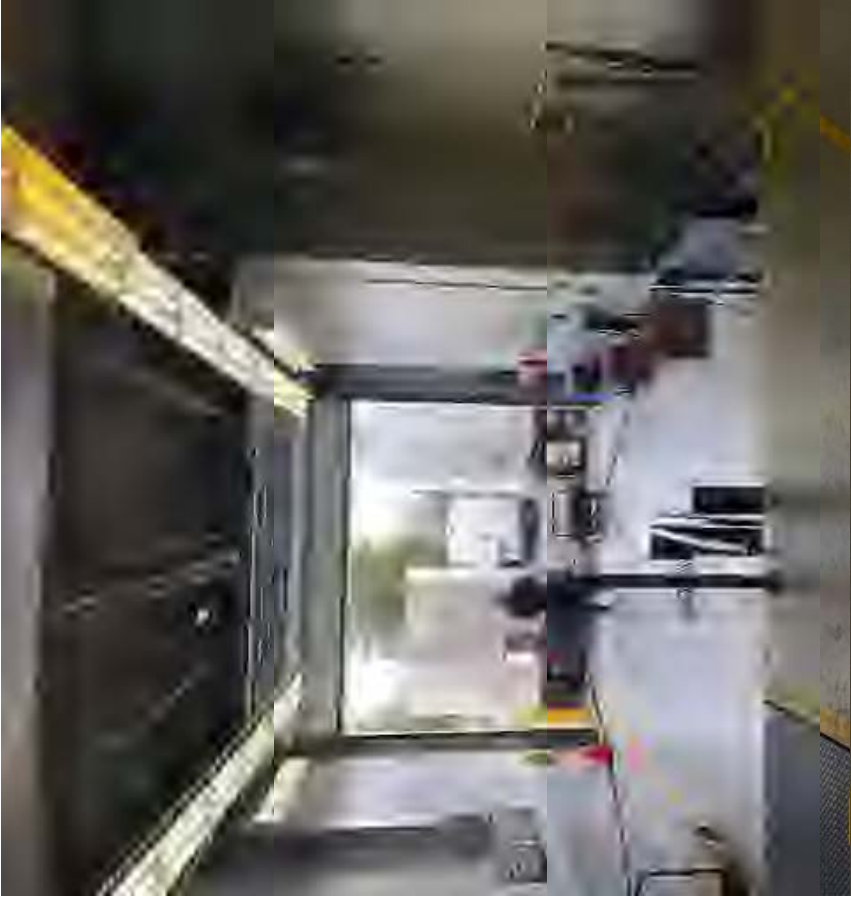
Figure 1 – Receiving & Loading / Réception et chargement – Room / salle 120