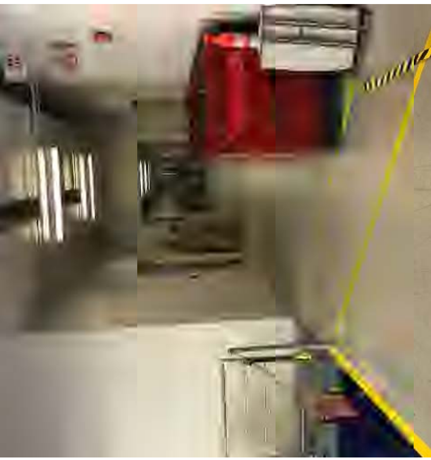
Figure 2 – Looking down corridor from loading dock / En regardant le couloir du quai de chargement – Room / salle 153