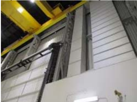
Bay 3 overhead sectional door photo 01