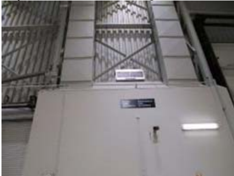
Bay 3 wall middle section photo 02