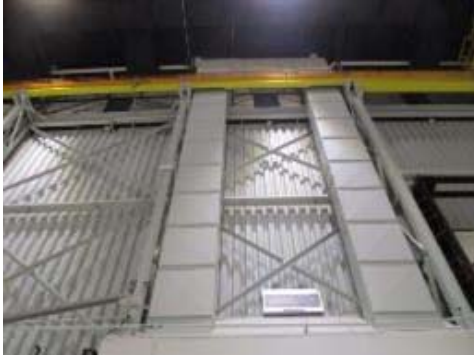
Bay 3 return air grilles photo 01