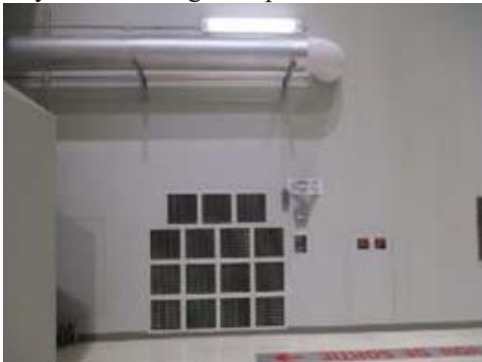
Bay 3 wall south end section photo 01