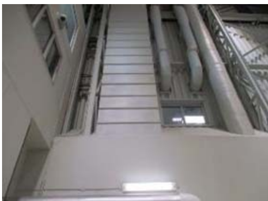
Bay 3 wall south end section photo 02