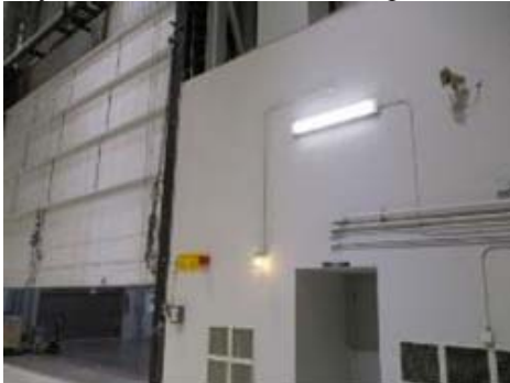
Bay 3 overhead sectional door photo 02