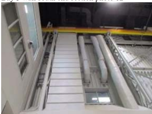
Bay 3 wall uppers section photo 01