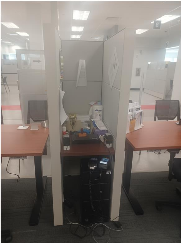
Photo du « U » et de la tablette à fixer entre les panneaux à Mont-Laurier