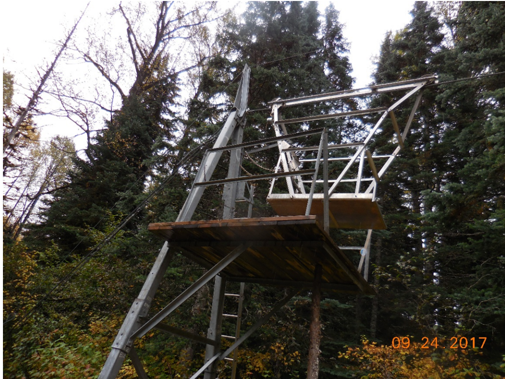
Photo 2. Bac à câble existant