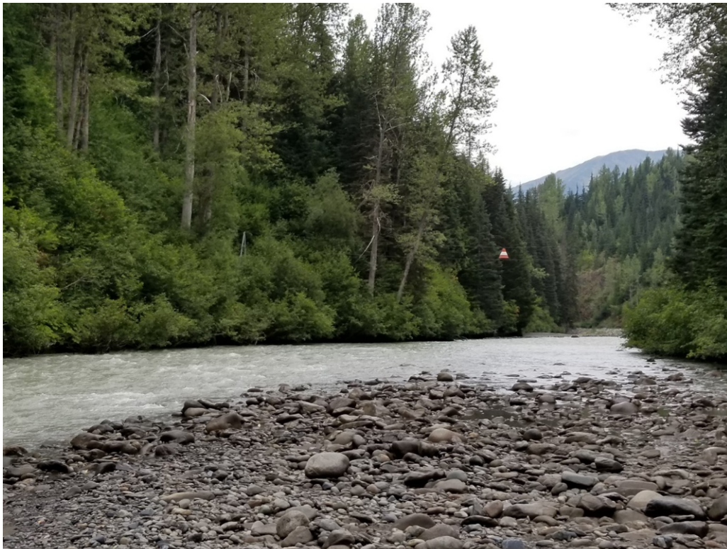
Photo 1. Vue générale du téléphérique