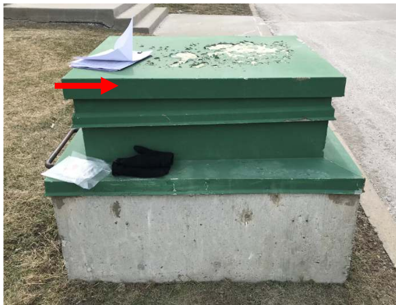
Photo 2. Peinture verte, associée à des trappes de Type C1; ici, l'on confirma que cette peinture renfermait 195 ppm de plomb (Échantillon de la société DST, portant l'identification : 1154-LP04).