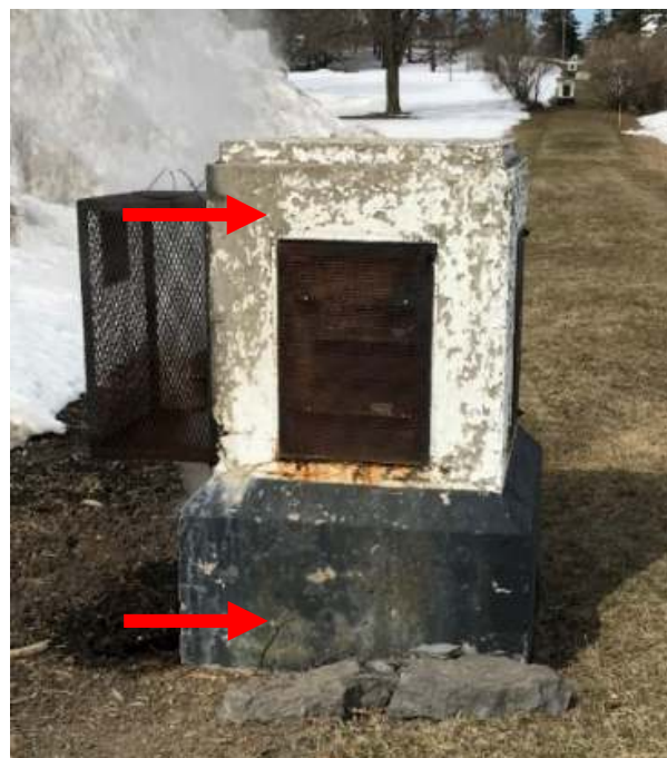
Photo 4. Peinture blanche, associée à des évents de Type M; ici, l'on confirma que cette peinture renfermait 5 710 ppm de plomb (Échantillon de la société DST, portant l'identification : 1154-LP18). Peinture noire, associée à des évents de type M; ici, l'on confirma que cette peinture renfermait 294 ppm de plomb (Échantillon de la société DST, portant l'identification : 1154-LP19).