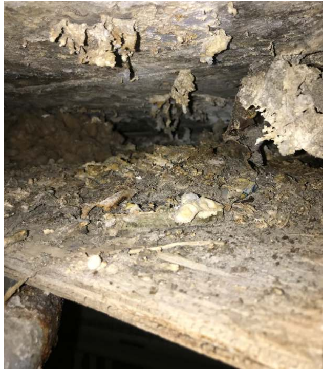
Photo 7. Divers débris, observés sur du contre-plaqué à l'intérieur des tunnels et ce, en dessous des évents annotés dans la section 5.1.2; ici, l'on confirma que ces débris n'étaient pas amiantés (Échantillon de la société DST, portant l'identification : 3603-01A-C to 08A-C).