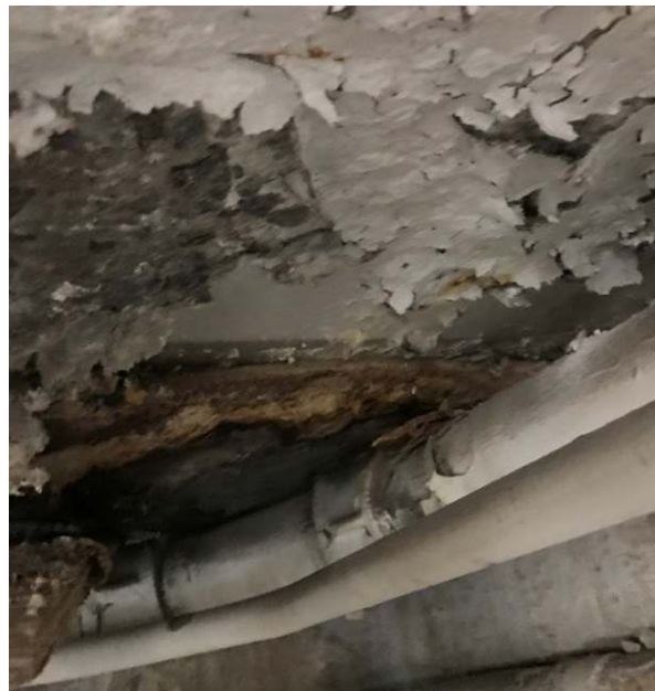
Photo 8. De la peinture de plafond blanche, à l'intérieur du tunnel et en dessous de l'évent V1 et de Type D; ici, l'on confirma que cette peinture renfermait 918 ppm de plomb (Échantillon de la société DST, portant l'identification : 3603-LP01).