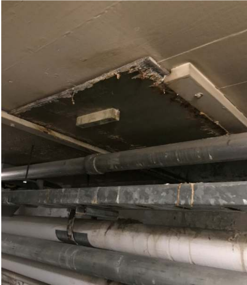
Photo 9. Peinture de plafond grise, à l'intérieur du tunnel et plus précisément, en dessous de l'évent V2 et de type D; l'on confirma ici qu'il y avait une concentration de 149 ppm de plomb) (Échantillon de la société DST, portant l'identification : 3603-LP02).