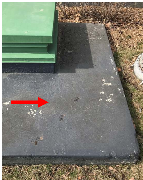
Photo 6. Goudron noir, observé au niveau du socle de la trappe H11 et de type Q; ici, l'on confirma que ce goudron renfermait 4,17 p. 100 d'amiante chrysotile (Échantillon de la société DST, portant l'identification : 1154-12A-C).