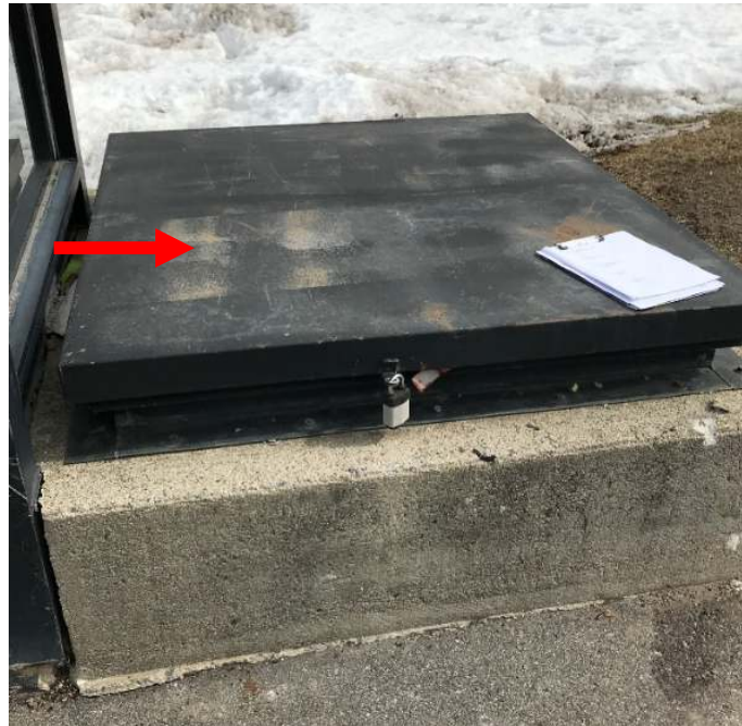
Photo 5. Acier noir et de fabrication d'usine, observé sur la Trappe H3 et de type H; ici, cette peinture ne peut faire l'objet d'aucun échantillonnage sans interférence au niveau du substrat, mais l'on se devrait de la considérer comme renfermant du plomb et ce, sauf dans le cas d'une preuve du contraire par de l'échantillonnage en vrac et des analyses en laboratoire.