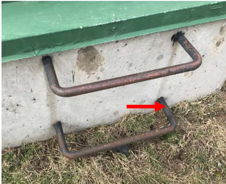
Photo 3. Peinture noire, associée à des barres d'armature sur les trappes de Type C1; ici, l'on confirma que cette peinture renfermait 316 ppm de plomb (Échantillon de la société DST, portant l'identification : 1154-LP05).