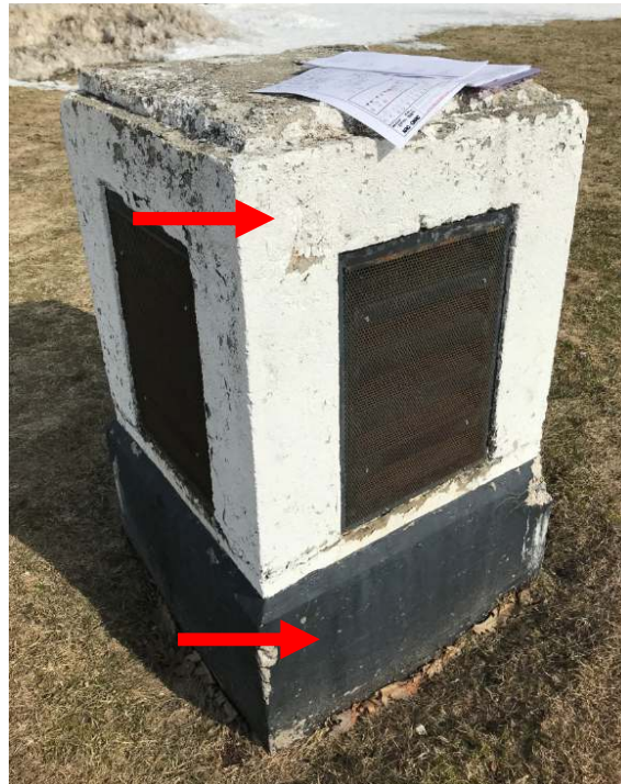
Photo 1. Peinture noire, associée à des événements de Type D; ici, l'on confirma que cette peinture renfermait 176 ppm de plomb (Échantillon de la société DST, portant l'identification : 1154-LP02).