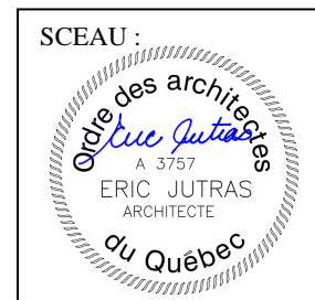
Eric Jutras Architecte