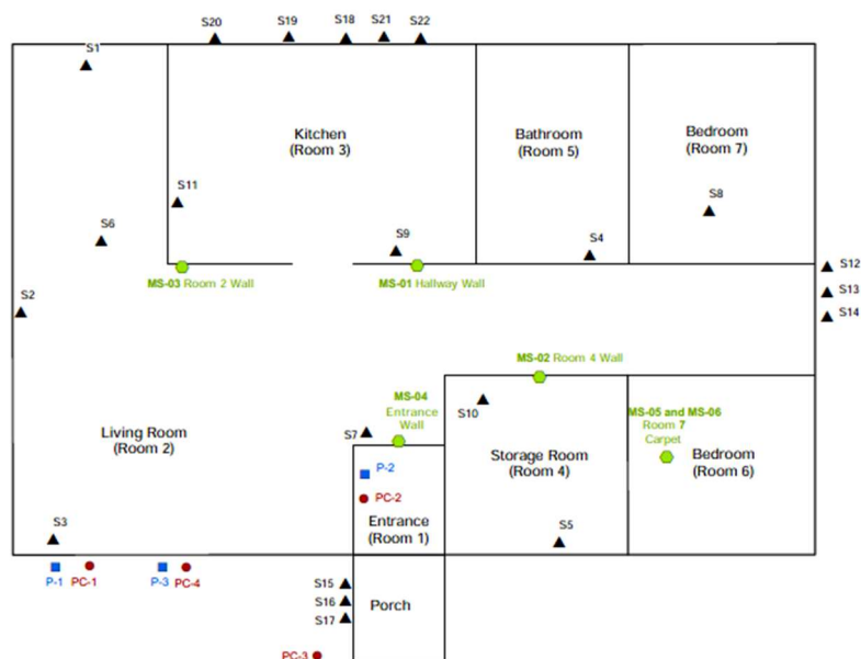
Photo 2 : Croquis du bâtiment et numéros des pièces. Dimensions approximatives du bâtiment : 8 m x 16 m (26 pi x 52 pi).