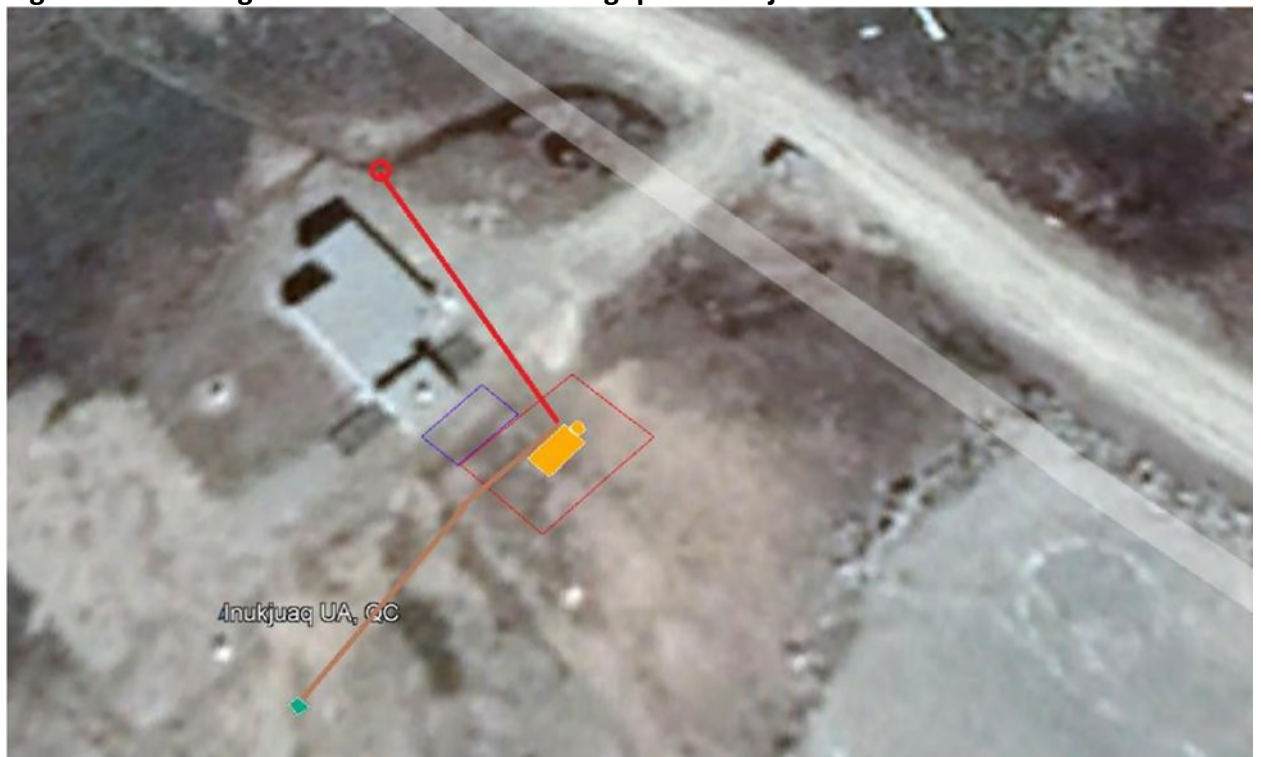
Figure 1 – Aménagement de la station aérologique d'Inukjuak

Ligne rouge – poteau électrique actuel et emplacement proposé de la tranchée de service pour l'alimentation électrique (33 m)