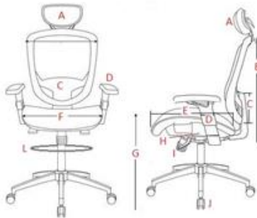
Tableau A2: Fauteuil Rotatif